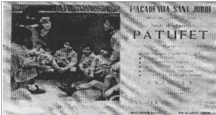
Fullet de propaganda de l'inici del Jardí d'Infància Patufet, el 22 d'abril de 1968