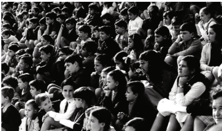
A dalt, sessió de titelles a la plaça de l'Ajuntament promoguda per l'Escola Activa de Pares. Fou una de les primeres actuacions en públic de Titelles Claca. A sota, la canalla atenta a l'espectacle.