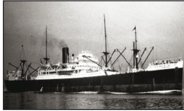
El Winnipeg va ser el vaixell triat per Pablo Neruda per portar més de 2.000 exiliats a Xile el 1939.

A la República Dominicana van arribar set grans embarcaments de refugiats entre el 7 de novembre de 1939 i el juliol del 1940. No s'ha pogut determinar el nombre exacte de refugiats que hi van arribar. La xifra que sembla més raonable és la que afirma que no van superar els 3.000 refugiats; 52 hi ha d'altres fonts, però, que eleven la xifra entre un i dos centenars més, la qual cosa podria situar la xifra total d'exiliats (afegint els viatges individuals, fins i tot posteriors) entre 3.200 i 3.400 persones. La majoria van ser enviats, només arribar als ports, a colònies agrícoles distribuïdes pel país, tot evitant així que els espanyols es poguessin instal·lar pel seu compte a les ciutats, on no hi havia mitjans de vida possibles per a tanta gent. Les condicions de negociació entre les autoritats dominicanes i els responsables del SERE van ser sempre difícils per les exigències econòmiques locals i, també, perquè s'incomplien.