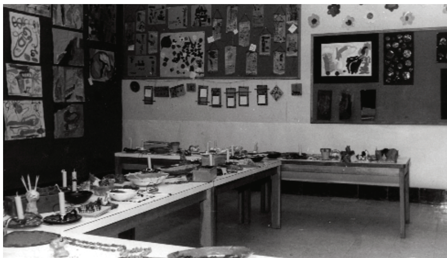
A dalt, edifici del carrer Frederic Prats, 3, on començà la història del Patufet. A sota, exposició de treballs a una classe del carrer Frederic Prats. Curs 69-70