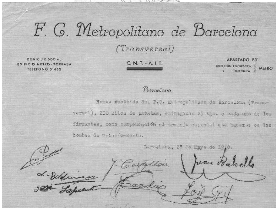
Foto 105 i 106. A dalt, emplaçament del moll de càrrega a què es refereix la carta. A baix, carta sobre el pagament en espècie als treballadors del metro. Col·lecció particular.