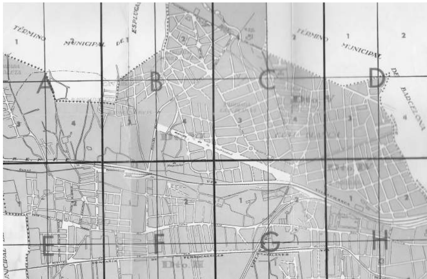
Foto 104. Emplaçament de l'estació a què es refereix la carta.

Aquesta era una pràctica corrent per part de molta gent, que havien de llençar els sacs o mocadors de fer farcells i saltar en marxa dels vagons, abans d'arribar a l'estació de Sants per tal de no ser detinguts, multats i veure confiscada la càrrega.