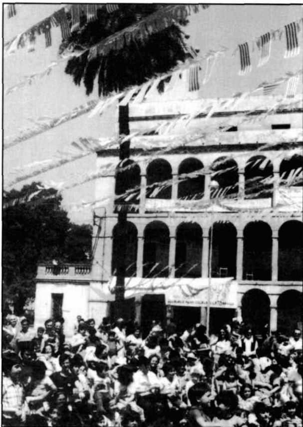
Festa Major de la Marquesa.

Espanyola. Entrats en aquesta dinàmica es comença a parlar de dues Festes Majors. La situació és aprofitada per l'Ajuntament per reorientar les festes restant tot el protagonisme dels veïns. Cal esmentar també un cert malestar que es va generar en voler incorporar una cursa de braus arran de la participació de la Penya Taurina en l'organització de les Festes. (El 1981 s'havia constituït el Club Taurino, a la Rambla Catalana). La Festa Major sembla, doncs, que entra en decadència quan l'Ajuntament intervé directament en la seva organització. Els darrers temps, però, havien estat durs. La participació a l'hora d'organitzar i treballar havia