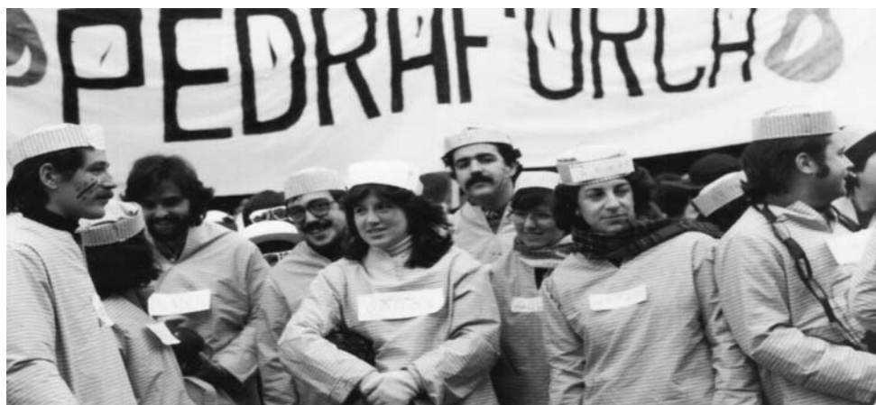
Carnestoltes 1983. Alumnes i personal del Pedraforça disfressats de presidiaris amb uns vestits confeccionats per unes monges!