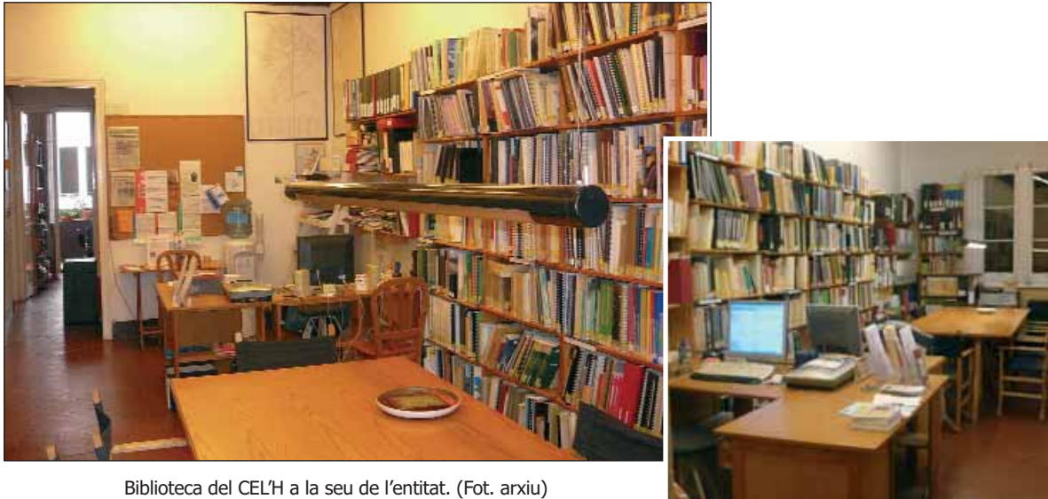
Biblioteca del CEL'H a la seu de l'entitat.

motors del Centre d'Estudis d'elaborar un atlas de la ciutat. Així doncs, ens prendrem la llicència de fer servir les paraules de Puchades com a motor de la primera bibliografia de l'any 1985, ja que per aquelles dates, la segona ciutat de Catalunya, a diferència d'altres pobles i ciutats del Principat, no tenia una eina semblant a la reivindicada per Puchades a l'alçada de la importància demogràfica de l'Hospitalet: