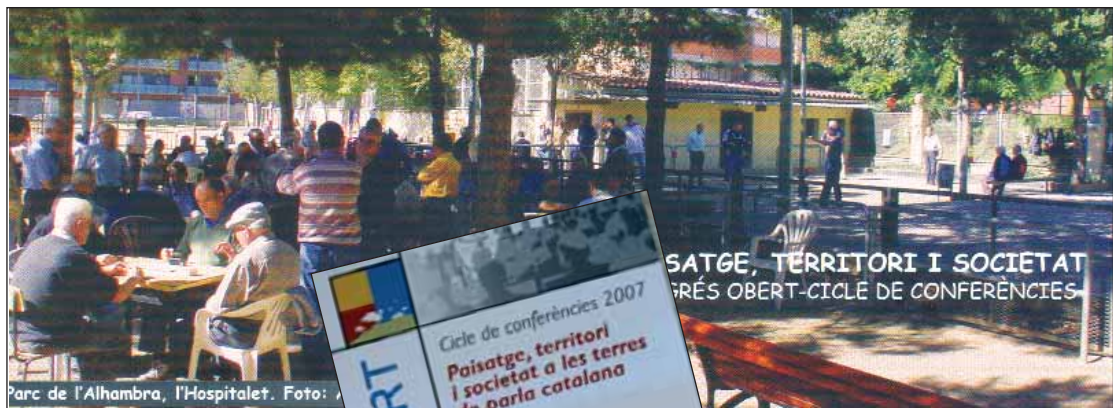
El CEL'H manté la seva contribució a la reflexió i el debat sobre el territori.

del Patrimoni Etnològic de Catalunya (IPEC), una tasca tan engrescadora com útil per a la normalització del país i que es va mantenir eficaçment fins fa tres o quatre anys. I, en el mateix espai de coneixement i divulgació, cal constatar –en íntima col·laboració amb la comissió municipal creada a l'efecte– l'esforç dut a terme sobre el nomenclàtor de carrers de l'Hospitalet –una documentació especialment consultada al CEL'H i ara mateix pendent de la seva redacció definitiva, prèvia a la publicació– que juntament amb l'enorme esforç d'inventari bibliogràfic sobre la ciutat –un dels treballs emblema de l'entitat des de gairebé els seus inicis–, posa de manifest la contribució del CEL'H a la recuperació de la història de la ciutat, que és un altre índex notable de normalitat cívica.