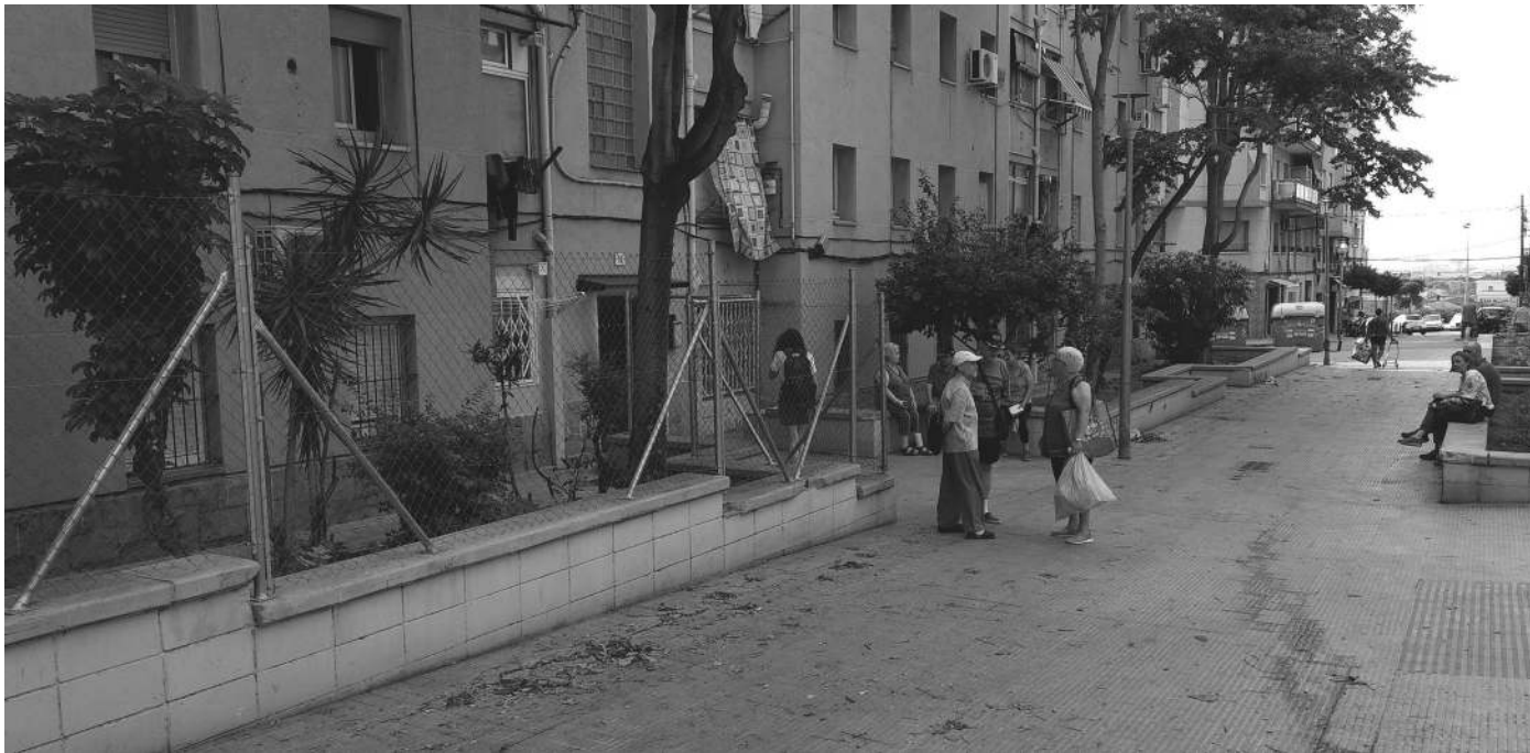
Els Blocs Florida, a l'actualitat / La Fundició

92 guer, i que era l'OSH qui no ho acceptava. Dels 816 pisos, 462, és a dir, més de la meitat, van estar d'acord a no pagar les contribucions especials, tot i que l'objectiu de l'assemblea veïnal era arribar als 700. Es tractava d'una mesura de pressió perquè l'empresa, que en qualsevol moment podia cobrar els diners del lloguer que els veïns pagaven religiosament cada mes en un compte corrent, portés a terme les reformes i el manteniment necessari.