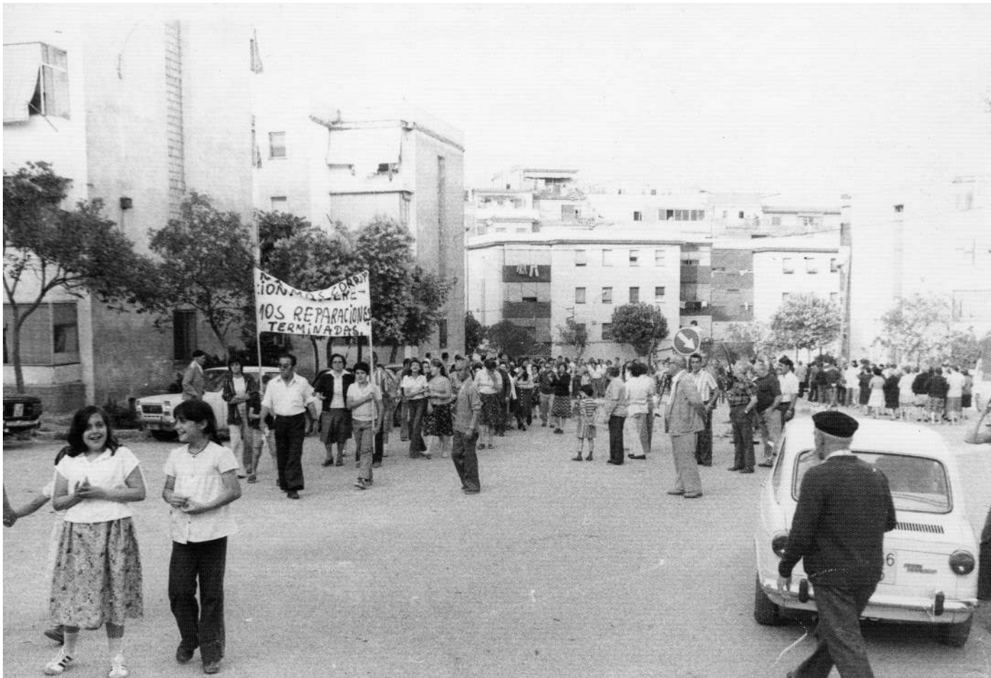
Una de les manifestacions, amb tall de trànsit inclòs, per demanar millores als Blocs Onésimo Redondo / José Cera

Més enllà del to humorístic i satíric del poema, cal ressenyar la crida que fa a la participació veïnal i el suport mutu per aconseguir millores per al barri. En el capítol anterior hem comentat que al Ple en el qual es va aprovar el Pla Parcial de la Florida, el 1974, la presència veïnal va ser més aviat minsa, tal com descrivia l'autor d'una crònica periodística. I és que les crides al veïnat perquè participi més activament de l'associacionisme venen de lluny i no són pas una novetat dels nostres temps, en els quals l'acti-