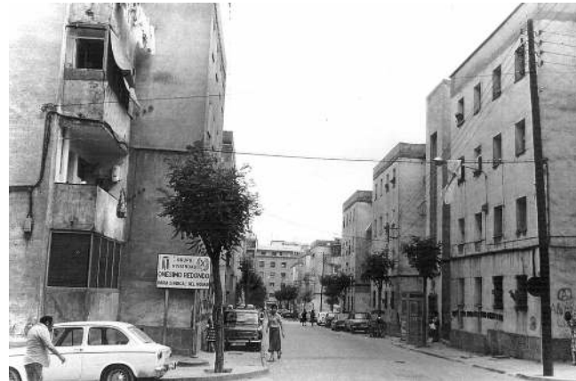
Una imatge dels Blocs Florida durant la dècada dels 80

Per altra banda, els veïns reclamaven que el preu de lloguer dels pisos no superés el 10% del salari base. En aquesta línia, detallaven que de les 200 pessetes mensuals que pagaven, la meitat anaven a parar a la conservació dels blocs, mentre que les altres 100 servien per pagar l'entrada del pis que els havia avançat el banc. Ho comentem perquè, de fet, el 1975 la meitat dels habitants dels blocs van decidir deixar de pagar una part de la mensualitat de les seves cases fins que no les ar-