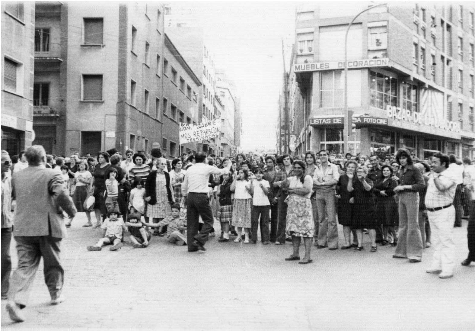
Una altra manifestació dels veïns dels blocs, en aquesta ocasió del 1978, per l'estat dels edificis

també se'n va fer ressò de les declaracions de Capdevila i, en llegir-lo, els veïns van sortir al pas per preguntar qui havia decidit l'enderroc i per exigir que, en cas de realitzar-se, que es fessin els nous habitatges al mateix lloc 97 . A