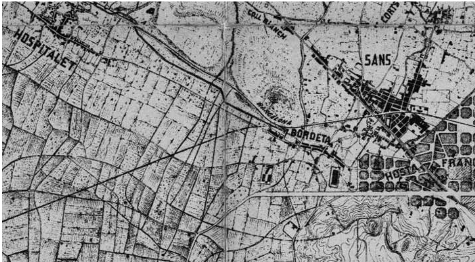
Mapa del 1888.

El 8 de juliol, el capità general de Catalunya, que era la màxima autoritat de facto del Principat, Manuel de la Concha, decretà un estat d'excepció (que prohibia fins i tot "el uso y retención de todo palo grueso") i creà una "Comisión Militar Ejecutiva y Permanente de la Plaza y Provincia de Barcelona", que imposava la jurisdicció militar sobre la civil per tal de reprimir els motins. 31