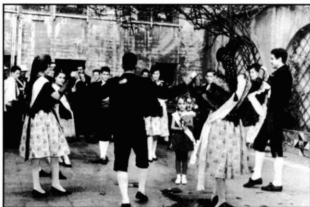
Ballada de sardanes per les pubilles dels barris. Pati bar Colonial. L'Hospitalet 1963.

Durant tot aquest temps, hi ha d'altres activitats que agrupen molta gent, encara que no sigui de forma massa regular. Una d'aquestes ocasions es presenta amb la Festa Major. Els anys seixanta l'envelat de Collblanc es fa davant del mercat, on hi havia el mercat del Born (anteriorment s'havia fet al camp de futbol).