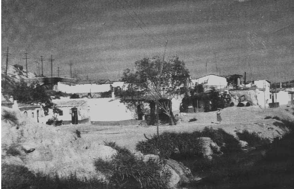
Barraques situades a Matacavalls. Sant Josep. Carrer Estrella. Font: CEL'H. 1956.

contra el que de més sant i sagrat tenim a Catalunya: la tranquil·litat, la vida pacífica de la nostra gent; d'aquella gent que pensa i treballa en català, i sols vol que la deixin lliure i tranquil·la per estendre els seus braços, per agermanar la humanitat tota. (...)