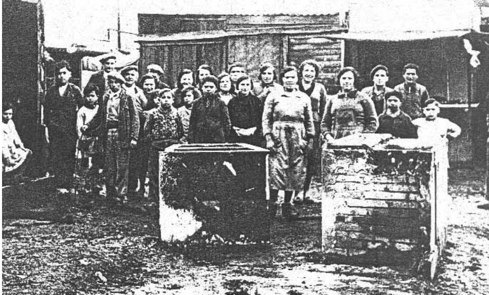
Incendi de les parades del mercat de Santa Eulàlia durant la proclamació del comunisme llibertari a la ciutat. La Humanitat, 10 de desembre 1933

macions com "aquella colònia (la Torrassa) viu sota un règim d'amor lliure" (Sentís 1994, pàg.73) i encara és més denigrant quan parla del que ell anomena "el matrimoni a prova" (Sentís 1994, pàg. 75). Tothom que conegui Andalusia sap que les famílies que econòmicament no podien fer una festa per casar-se, el que feien era marxar del poble uns dies i, en tornar, la nova parella era reconeguda per tot el poble.