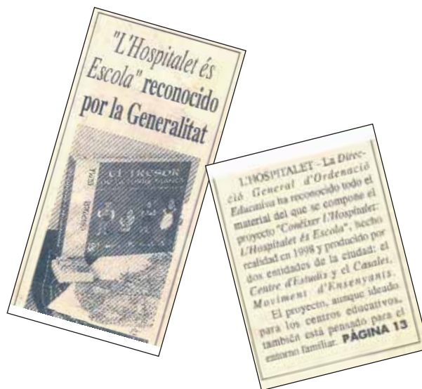
Articles sobre L'Hospitalet és escola a La Vanguardia. Suplemento l'Hospitalet y Baix Llobregat, 12 de desembre de 1995. (Arxiu)

El resultat final van ser uns dossiers adaptats als diferents cicles educatius, un conte per als nois i noies entre deu i dotze anys, un disc amb textos i cançons, amb guia didàctica, una caixa de jocs per a secundària, un titella per a educació infantil, un joc molt complet de mapes i gràfics i una col·lecció de rutes urbanes per conèixer els diferents indrets i barris de l'Hospitalet. La finalització del projecte va comptar amb una jornada d'un dia sencer amb tallers participatius i xerrades diverses.