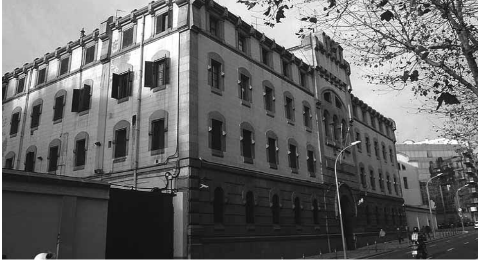
Presó Model de Barcelona.

munes, que redimien les seves penes. Aquest fet va ser detectat en observar que les comunes feien més feina de la que realment podien fer, i els van posar un límit al seu treball, per evitar aquesta col·laboració.