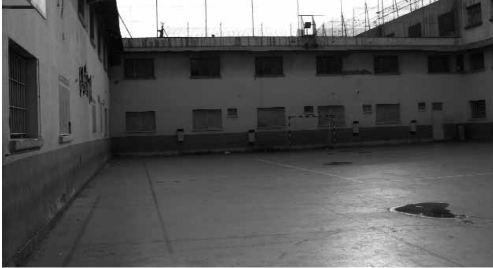
Pati interior de la presó de la Trinitat.