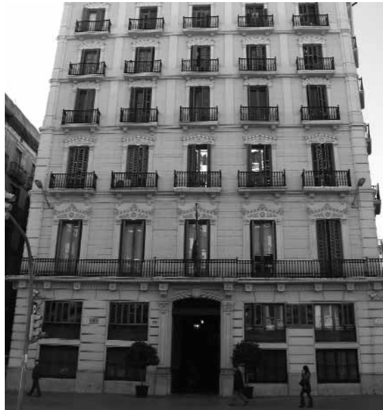
Jefatura de Policia de Via Laietana.

Els condicionaments afectius incidien en viure l'empresonament com un fet més o menys dolorós o desconcertant, segons fossin, acceptats o no, pels seus familiars i amics.