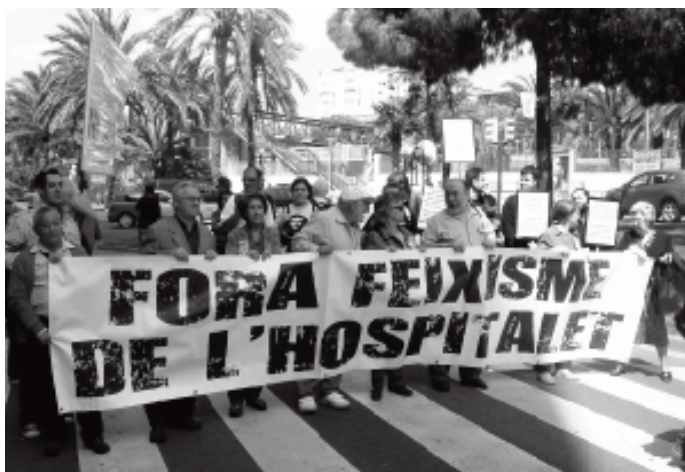
Manifestació convocada per Unitat Contra el Feixisme i el Racisme (UCFR) a l'Hospitalet el 30 d'abril de 2011.

intern del grup local UCFR era sobre si parlar obertament de PxC podria suposar fer-ne propaganda, perquè a fi de comptes eren una formació extraparlamentària i algunes persones creien que si n'esmentàvem les sigles estàvem donant-les a conèixer entre potencials votants. Finalment es va optar per parlar de racisme i convivència en termes generals a les octavetes i esmentar PxC de passada; un greu error, com després vàrem comprovar, ja que el principal problema era que aquelles persones que votaven PxC no els identificaven en absolut com una formació feixista o racista, gràcies al seu emmascarament com a respectable partit demòcrata.