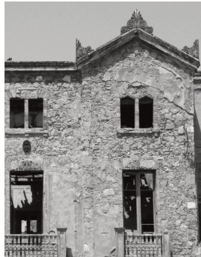
A la fotografia de dalt, detall de Cal Pau de l'Arna i, a la de baix, detall de la Torre Gran.

de pedra treballada a les finestres i portes, quasi acadèmica, molt pròpia d'una masia bastida o reformada al segle XVIII" (2001: fitxa 9). Les façanes de carreus són ben treballats i escairats com a ca l'Esquerrer i a l'Harmonia, que els carreus són petits i més grans als angles. Moltes de les masies es divideixen en tres crugies (espai comprès entre dos murs de càrrega) en direcció nord-sud per a estar orientades a sud com ca l'Esquena Cremat o cal Canari de tres o quatre metres de llum. Algunes cases més riques constructivament presenten set crugies com a la Torre Gran. Els seus murs són gruixuts, d'uns 50 o 60 centímetres, i els forjats són de bigues de fusta amb revoltos com veiem a la Torrassa (PEPPA, 2001: fitxa 55, 97 i 99) i a la Torre Gran, i teula àrab a les teulades com a can Trabal (PEPPA, 2001: fitxa 9). En alguns espais concrets de les cases es poden trobar voltes de canó, com al celler de ca l'Esquerrer (PEPPA, 2001: fitxa 59) o, fins i tot, voltes apuntades recolzades en pilars de pedra o maó i de bigues de fusta com es pot veure a l'antic celler subterrani de Pubilla Casas.