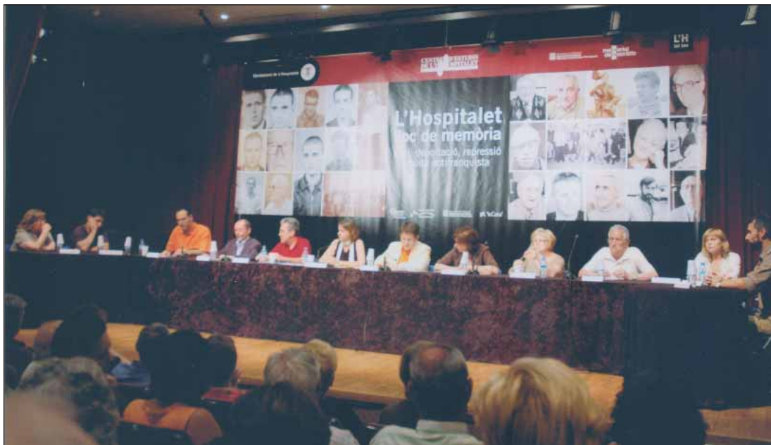
Acte de presentació del llibre L'Hospitalet lloc de memòria. Exili, deportació, repressió i lluita antifranquista , culminació del treball i la voluntat de recerca i difusió del CEL'H sobre l'antifranquisme.

el projecte col·lectiu més ambiciós van ser les jornades El Segle XX a Debat, amb motiu dels 75 anys de la concessió del títol de ciutat. Les jornades volien ser un replantejament de la història del segle XX a l'Hospitalet a partir de la comparació del model de ciutat amb altres experiències. El debat es va organitzar a partir de tres eixos, que podem sintetitzar com a demogràfic, urbanístic i sociopolític, amb tallers previs. Les ponències i els debats es van publicar als Quaderns d'Estudi l'any 2001.