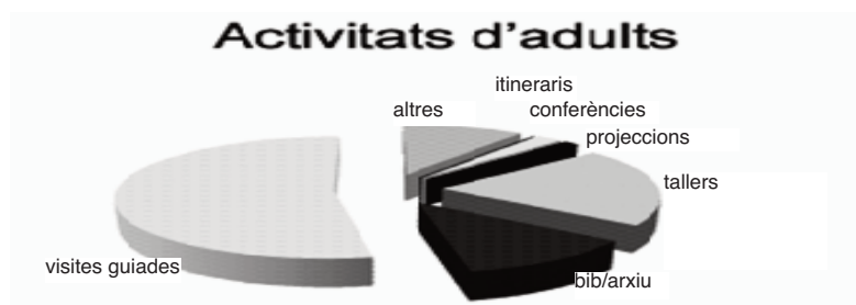
Activitats per a adults del Museu

Un altre canvi organitzatiu ha estat el de la diversificació de les activitats i la recerca d'un públic adult. A més del tradicional públic escolar, doncs, s'ha procurat ampliar l'oferta d'activitats per captar usuaris que presentin perfils diferents.