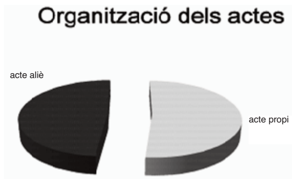
Actes del Museu de l'Hospitalet segons l'organitzador

En aquest moment podem afirmar, amb orgull, que gairebé la meitat dels actes que es fan al museu els han organitzat entitats i ciutadans que pensem que aquest equipament no tan sols és el que resol de forma més adequada les seves necessitats tècniques sinó que també els ofereix un plus pel tipus d'espai en què es desenvolupen els seus actes.