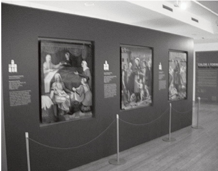
Vista de l'exposició permanent de Santa Eulàlia de Mèrida. Edifici l'Harmonia

L'activitat oferta a les escoles des del Museu de l'Hospitalet ha evolucionat tot complementant-se amb la inclusió de noves ofertes. Fins l'any 2009 el Museu tan sols ofería les Rutes Urbanes en les seves diverses variants i la Visita a l'Ajuntament com a oferta educativa a les escoles.