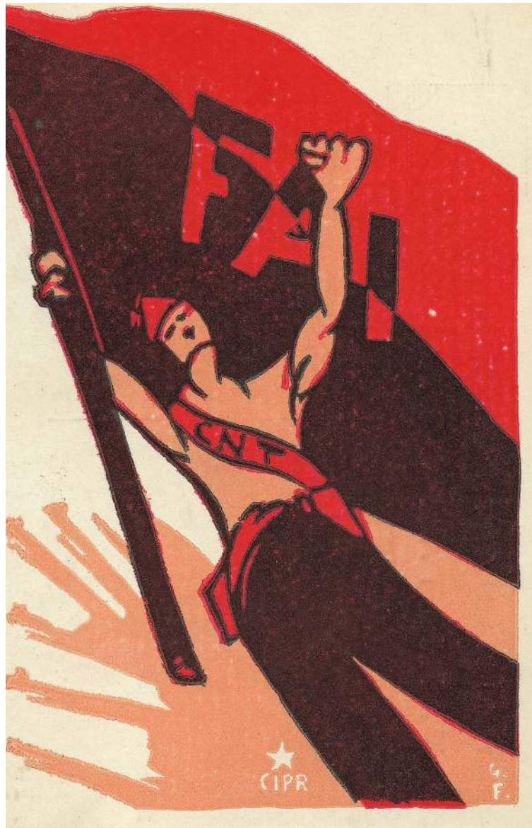
Foto 10. Targeta postal de les milícies antifeixistes de Catalunya.