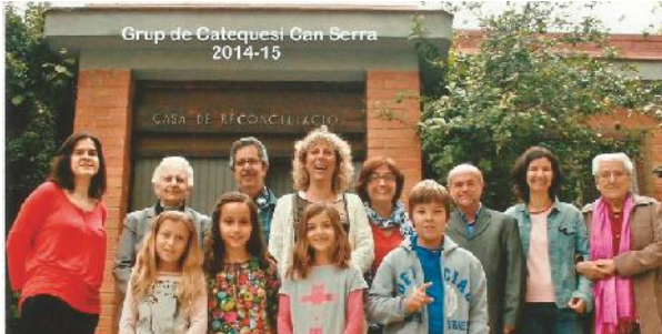
Un grup de la comunitat de Can Serra. 2015. MP