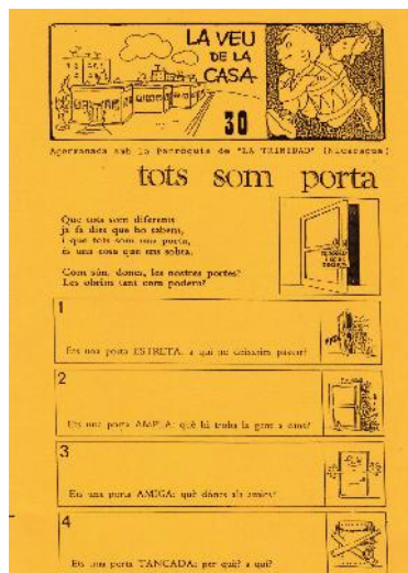
Full informatiu de la Casa Reconciliació.1993. MP