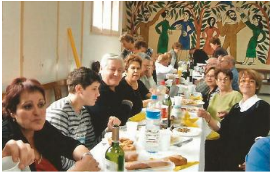
Compartint el xai. PB