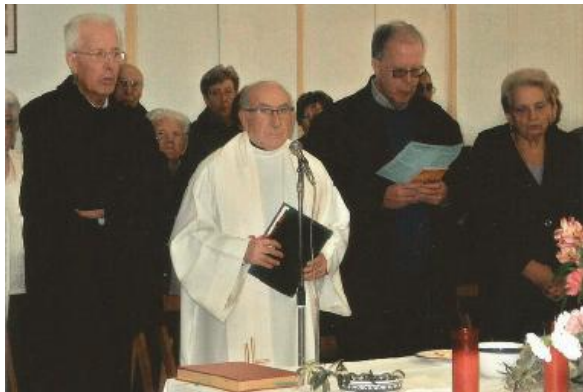
Canvi de rector 1998. MP

col·labora amb el Grup de Festes tant per la Festa Major com en els cafès concert al llarg de tot l'any.