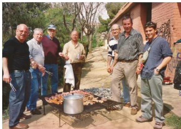
Festa del xai 2005. JG