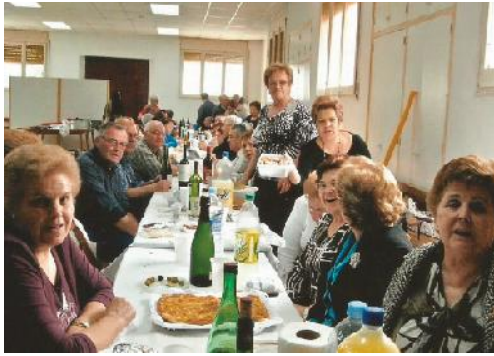
Compartint el xai. JG