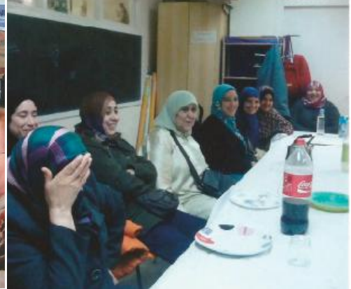
Escola formació permanent. 2014 MP

barri: la llum natural i l'escalfor del sol tornen a entrar als nostres locals; hem renovat la instal·lació elèctrica, els aparells de calefacció, els lavabos, la façana, la pintura interior i exterior, el mural, les cadires, la megafonia, el terra, per aconseguir trobar-nos còmodes i de manera digna i sòbria, familiar. Feia anys que no es feia cap tipus d'actuació en la millora de les instal·lacions i ara ja ens queda poc per aconseguir una renovació total.