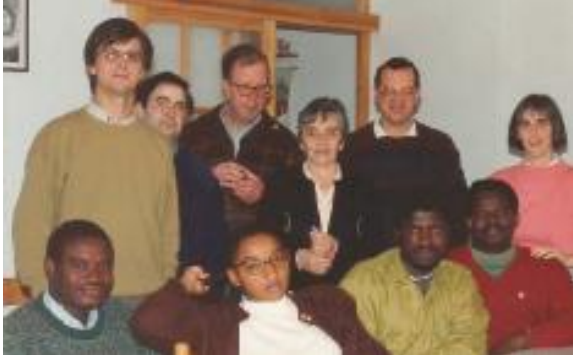
Fent comunitat amb gent de diversa procedència. MP

mateix temps, que sigui acollida i celebrada aquesta aportació. Principalment a les dones, per la seva flexibilitat, originalitat, per les seves capacitats i perquè és el col·lectiu majoritari dins de la comunitat.