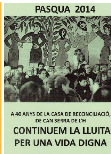
40 anys Casa Reconciliació. 2014

Un dels elements més importants de la parròquia ha estat la Solidaritat Internacional i el treball per la pau. De totes maneres la parròquia sempre ha considerat que aquests són temes transversals i per això tot el que s'ha fet en aquest sentit s'ha fet conjuntament, especialment amb el Grup de Dones, però també amb l'Associació de Veïns i l'Escola de Formació Permanent. Per això hi dediquem un apartat especial.