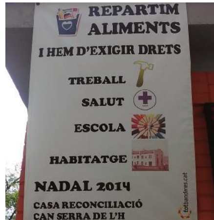
Banc d'aliments 2014. MP

Gratuïtat en els serveis i les atencions... i al mateix temps transmetent la convicció de la coresponsabilitat també en les despeses quotidianes... no s'arriba a cobrir totes les despeses de funcionament, però s'ha guanyat en aquesta direcció.