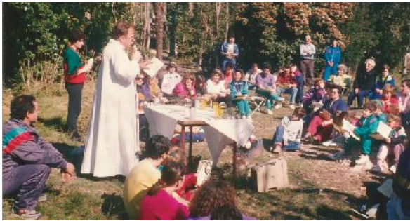
Primera comunió al camp, 1993. MP