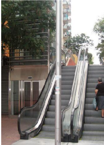
Millores en la mobilitat del barri. 2016. Boni

baixats, etc., podem dir que quasi queda resolt el tema de la mobilitat.