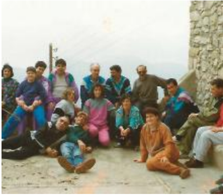
Sortida a Corbera. 1992. Boni