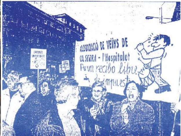
Una de les lluites més importants, el rebut de l'aigua. 1993. FAVV 215

La mobilització popular combinà les accions clàssiques (manifestacions, concentracions, etc.)