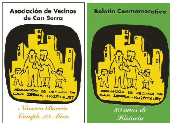
Conte i butlletí dels 50 anys del barri 2016. AVV

S'informa que l'espai que ocupava la Cardoner serà el parc urbà més gran de l'Hospitalet, i que es farà en breu la inauguració de la Llar de Gent Gran. Es pavimentarà l'Avinguda Can Serra fins al carrer Molí, així com els accessos al Col·legi La Carpa i el Mercat Municipal. Es compra el solar de Gregorio Ferrer i es vol mirar la reconstrucció del pont que passa per sobre les vies i uneix el centre amb Can Serra. Queda pendent el solar per a la biblioteca i s'avança en les negociacions dels solars de la CAMPSA.