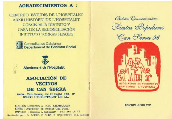
Butlletí dels 40 anys del barri 1996. AVV

Es comunica que està aprovada la segona fase del Parc de Can Buxeres i es comenta que el palauet serà un saló de convencions de l'Ajuntament a la 1a. planta, escola de música a la 2a. i la casa petita dels masovers serà una escola de Ciències naturals. La llar de gent gran es diu que estarà en funcionament a mitjan 1985.