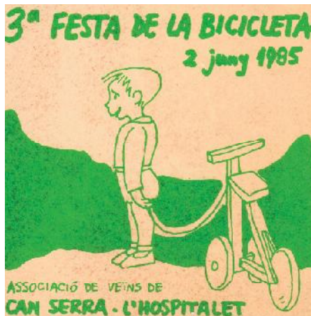
Activitat per promoure l'ús de la bicicleta. 1985. FPM