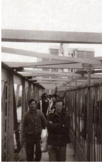
Pont de ferro amb la separació al mig. 1978, FPM

ces més. El 2003 es construeix un nou aparcament a Can Cluset amb 371 places i el 2004 es construeix un tercer aparcament a l'avinguda Isabel la Catòlica de 217 places més.