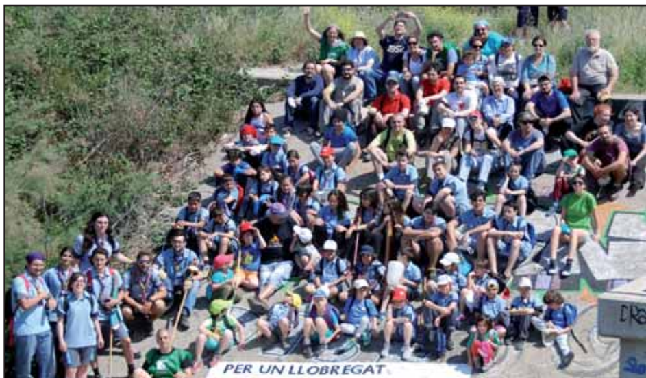
Els participants en les activitats riberenques en una foto de família.

A part de les activitats de cada entitat, s'han fet algunes activitats col·lectives. A l'empara de les Jornades Europees del Patrimoni a Catalunya 2014, el 27 de setembre 60 persones varen participar en una ruta pel camí del riu, pel pont i fins la bassa de laminació i la zona per sota de la Granvia fins a cal Capellà, organitzada