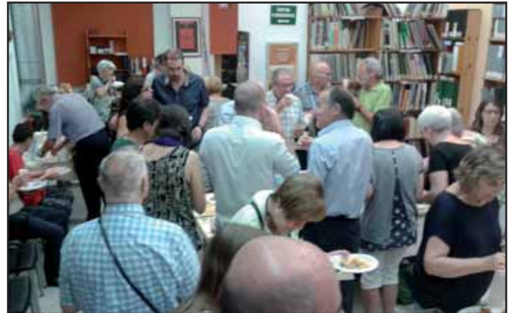
Una imatge del sopar de germanor de l'any passat a la seu del Centre.

Les inscripcions es podran fer fins el dia 25 de juny per telèfon (93 338 60 91), preferiblement en l'horari d'atenció al públic de dimarts, dimecres i di-