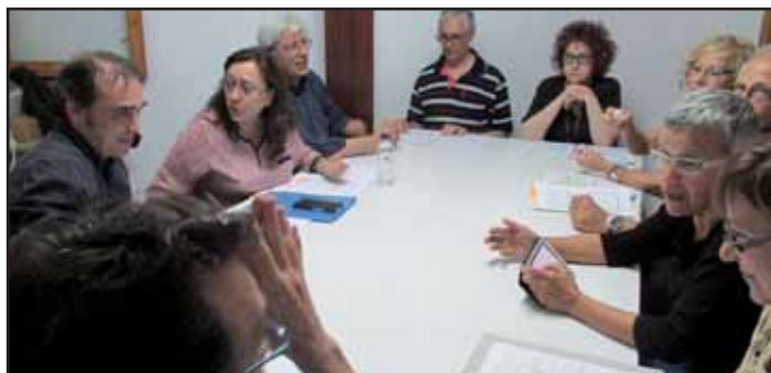
Els promotors treballant en el projecte.

El muntatge es basa en un collage de textos d' Els altres catalans i fragments de narracions candelianas, unides amb textos d'enllaç, que volen reflectir el significat de denúncia i esperança en què es fonamenta l'obra de l'escriptor. Seguint altres experiències, Joan Soto dirigeix un nombrós conjunt d'actors i escenògrafs provinents de diversos grups de teatre independent de la nostra ciutat que ha adoptat el nom d'"Amics d'Alpha 63", associació cultural hospitalenca molt activa als anys seixanta a la qual per-