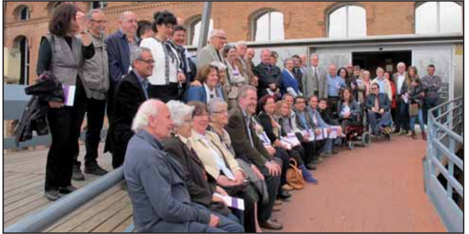
Els autors i autores en la foto de família al final de l'acte.

Al web l'Hospitalet escriu hi ha abocada tota aquesta informació ampliada i enllaçada al catàleg de les biblioteques per facilitar la cerca dels llibres. Com a novetat,