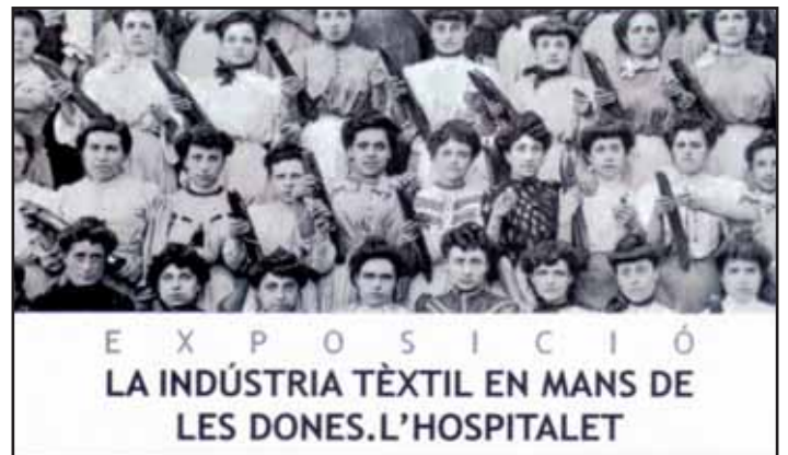
Cartell de l'exposició

Com cada any ha estat força nombrosa la presència de socis i amics així com d'altres persones que han conegut o han pres contacte directe amb l'entitat.