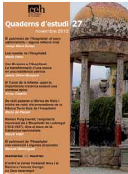
El Quaderns d'Estudi número 27 es va presentar a la sala d'actes del Centre Cultural Metropolità Tecla Sala, el passat 13 de març.

Més enllà, podem crear una oferta cultural que atregui a la població metropolitana i, per sobre de