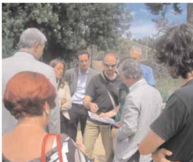
Una imatge de la visita a les restes del Canal de la Infanta.

Arran de la denúncia de l'abandonament de les restes del Canal de la Infanta feta per Ireneu Castillo al seu blog ( www.ireneu.blogspot.com ), un grup de persones i entitats ens hem agrupat amb l'objectiu de protegir les restes del que considerem que és un element patrimonial d'extraordinària importància per a la ciutat.