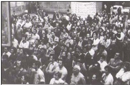
Assemblea de veïns i veïnes; lluita contra el Pla Parcial.

Al llarg d'aquest any el CEL'H organitzarà diverses activitats per recordar i commemorar el 40è aniversari de les associacions de veïns de l'Hospitalet. Creiem que és fonamental evidenciar el paper que van tenir en la lluita antifranquista i en la millora de la nostra ciutat. Enguany aquest serà un dels eixos destacats de l'entitat en relació a la recuperació de la memòria històrica. En els propers dies ens posarem en contacte amb les AA.VV. per treballar conjuntament.