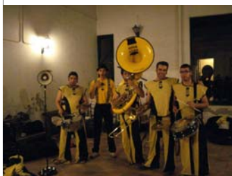
Dues imatges de la seu del CEL'H la nit del divendres 3 de juliol.