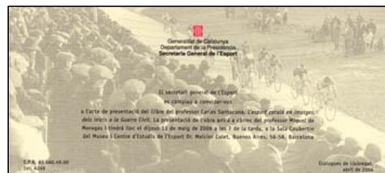
Carles Santacana L'esport català en imatges, dels inicis a la Guerra Civil. Ed. Les Punxes, abril 2006