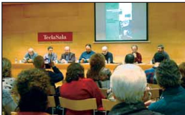
La taula d'autors del darrer número de Quaderns d'Estudi

Han passat 28 anys des que es va presentar el primer Quadern d'Estudi. Un Quadern que amb caràcter miscel·lani incorporà articles de personalitats de prestigi reconegut internacionalment com Pierre Vilar i d'investigadors locals com Jaume Codina amb aportacions de futures promeses en el camp de les ciències socials.