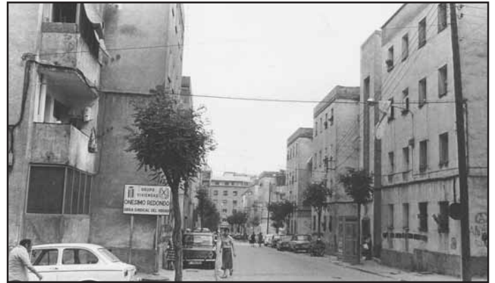
La història de l'Hospitalet, una síntesi del passat com a eina del futur

D'aquí la convocatòria de les Jornades d'octubre que han de servir com a punt d'arrencada de la confecció del nou llibre. Tothom que vulgui participar