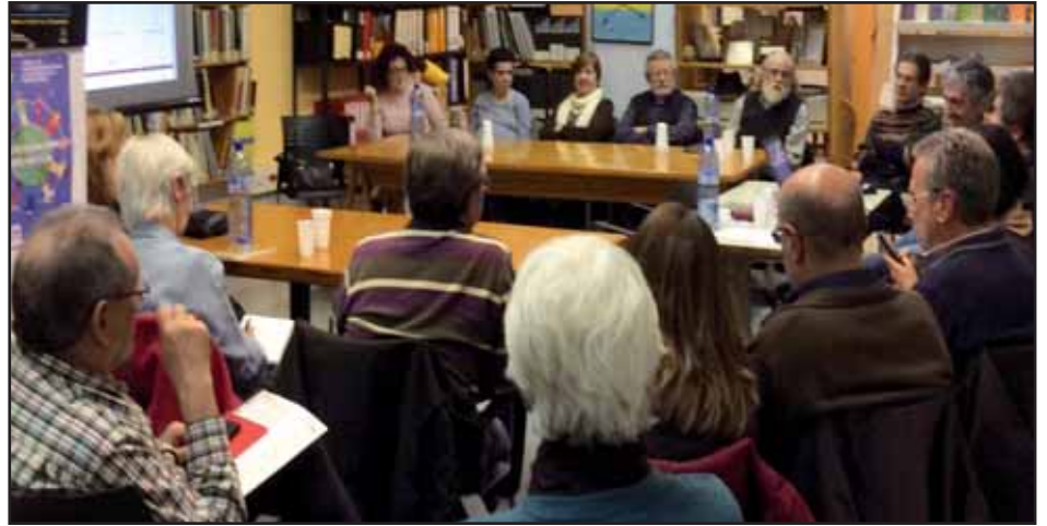
Una imatge de l'assemblea anual de socis d'enguany

Una situació que també es plasma en la part econòmica on podem destacar que no hem tin-