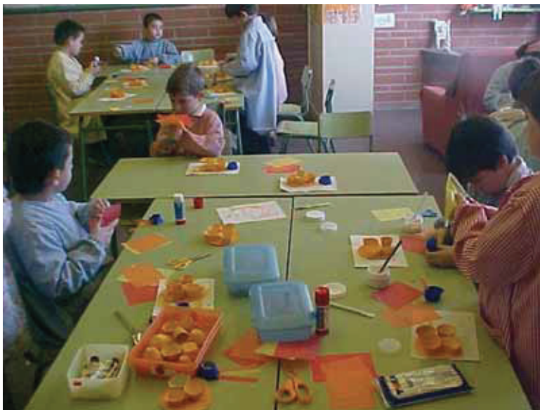
Treball a un taller de plàstica.

de l'escola, sinó del barri i ciutat, de solidaritat, de comprensió de l'avui i de l'ahir, per anar esdevenint persones, ciutadans joves i adults que comprendran i s'interessaran pel seu barri, sigui aquest a l'Hospitalet o sigui a una altra banda de món, com molt bé ens podrien explicar els exalumnes del nostre centre».