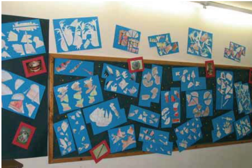
Una de les innumbrables exposicions del treball plàstic dels alumnes que es pot trobar en qualsevol moment del curs al Patufet.