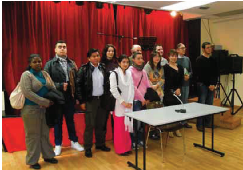
Foto de grup dels lectors de l'acte sobre diversitat lingüística, emmarcat dins el programa Pessics de Ciència (del CC de Sant Josep)