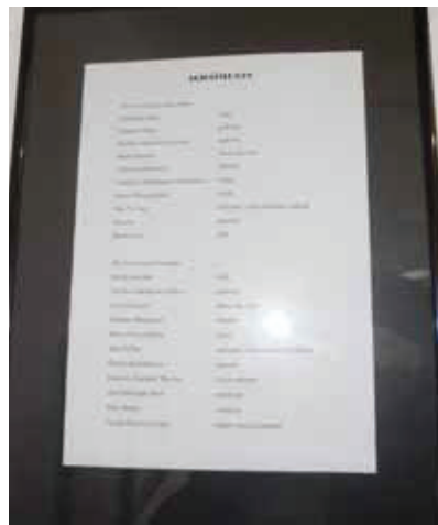
Agraïment als lectors i traductors