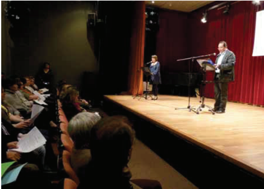
Acte de cloenda de la Gimcana de les Llengües 2011