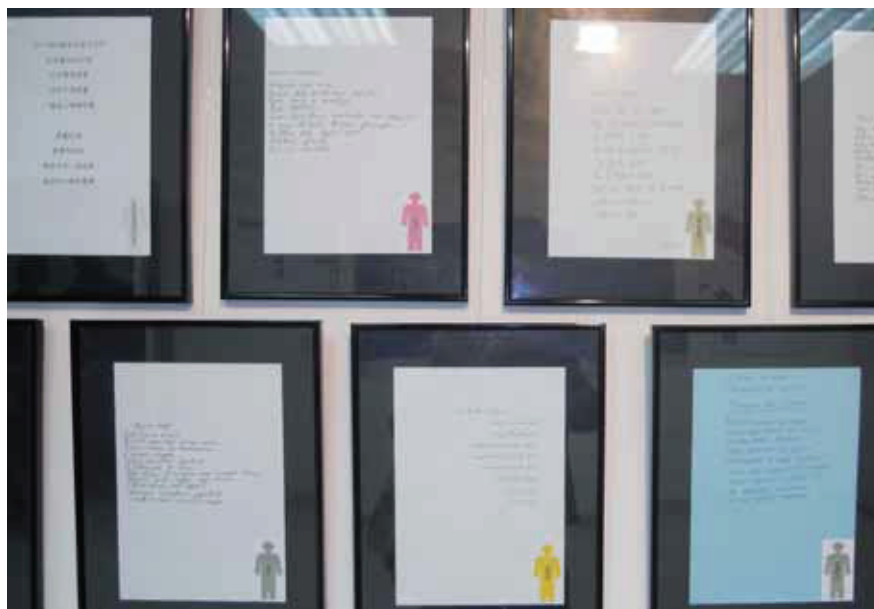
Mostra de poemes traduïts