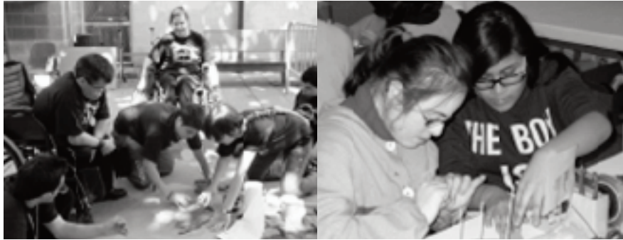
Sempre actius, fent moltes i variades activitats