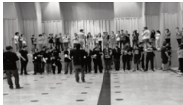
Actuació en el Palau de la Música Catalana