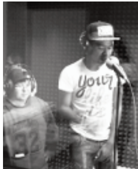
Gravació del rap a Torre Barrina