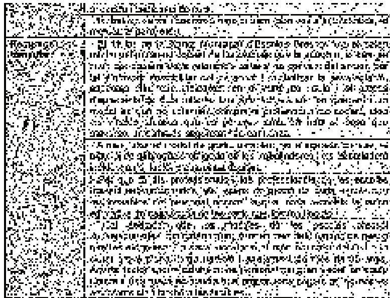
Font: Projecte Educatiu Marc de les Escoles Bressol de l'Hospitalet

En la nostra recerca per establir un "estat de la qüestió", és a dir, saber quins altres municipis han elaborat projectes educatius per a les seves escoles bressol, podem citar Mataró, Viladecans, Girona, Barcelona i Guadalajara. Cada un d'ells amb un estil propi, és a dir, alguns han elaborat una "carta de serveis", altres un projecte educatiu per a les escoles bressol municipals de la seva ciutat afegint-hi aspectes normatius i de funcionament. D'altres han descrit el model educatiu de les seves escoles bressol. Tots ells, però, amb un denominador comú: s'han centrat en les escoles bressol de titularitat municipal. En el nostre cas, a l'Hospitalet hem cregut oportú elaborar un projecte educatiu marc, de ciutat, obert a tothom, convidant totes les escoles bressol i llars d'infants sostingudes amb fons públics, compartint objectius i respectant els trets d'identitat de cada una d'elles. I, sobretot, convidant tota la comunitat educativa de l'educació infantil i altres professionals que treballen amb la petita infància per sumar, compartir i fer, d'aquest document, una eina de referència que, entre tots, hem d'anar desenvolupant i inserint en el dia a dia del funcionament dels centres educatius de la ciutat. No hem trobat cap altra experiència, a Catalunya ni a tot l'Estat, similar a la de l'Hospitalet, és a dir, un pro-