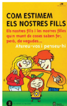
Fig. 4: Primera publicació intersectorial elaborada per serveis de Sta. Eulàlia

d'Acompanyament Educatiu a les Famílies (PAEF) de la regidoria d'Educació. Aquesta regidoria va signar un conveni de col·laboració amb l'Institut de Ciències de l'Educació (ICE) de la Universitat Autònoma de Barcelona (UAB) per impulsar el Projecte Educatiu de 0 a 6 anys a la ciutat i una de les activitats acordades va ser fer-se càrrec de la coordinació d'aquesta xarxa.