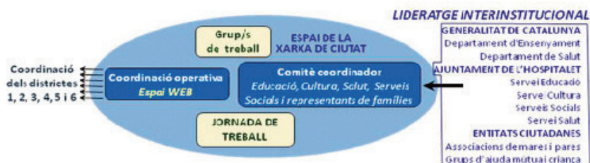
Fig. 13: Elements de la Xarxa de Criança i Educació a nivell de ciutat

El comitè coordinador és el lloc on es comparteix el lideratge interinstitucional de la xarxa de ciutat (fig. 13). La gestió del funcionament i dels acords del comitè coordinador la realitza la coordinació operativa, formada per dos professionals de la regidoria d'Educació. El comitè materialitzarà la seva tasca mitjançant la intermediació dels coordinadors de les xarxes de districte (fig. 14), organitzarà una Jornada de treball bianual i Grups de treball per realitzar un projecte intersectorial a termini i compartir amb tots els membres de la xarxa una Jornada bianual.