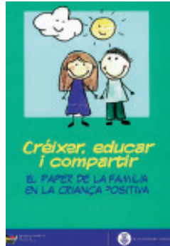
Fig. 8: Llibret elaborat per la xarxa de Bellvitge

Al curs 2015-16 s'han integrat en una xarxa de districte les dues xarxes dels barris de Bellvitge i del Gornal, per afavorir la connexió entre tots dos barris.