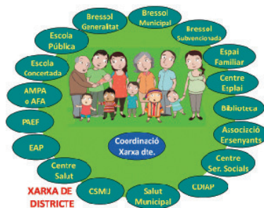
Fig. 1: Esquema de Xarxa de Criança i Educació de districte focalitzada en les famílies

Font il·lustració: Xarxa "Chile Crece Contigo" 4