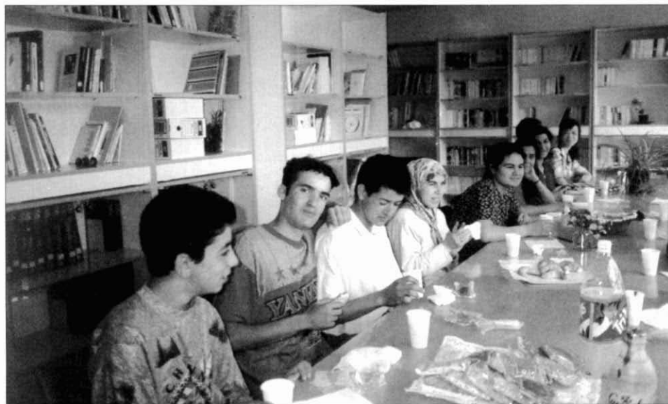
2. Festa de comiat del curs 95/96 de l'Aula de Joves. Aquest curs de formació estava integrat per joves magribins, gitanos, paquistanis i xinesos.