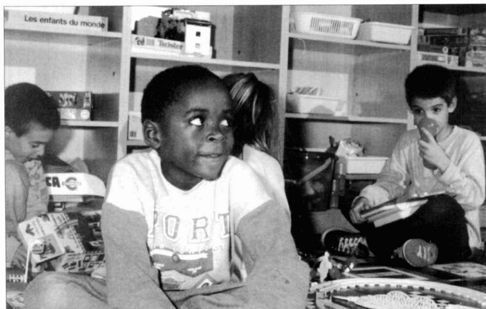
6. Nens i nenes jugant a un dels racons de la ludoteca de la Fundació Akwaba.