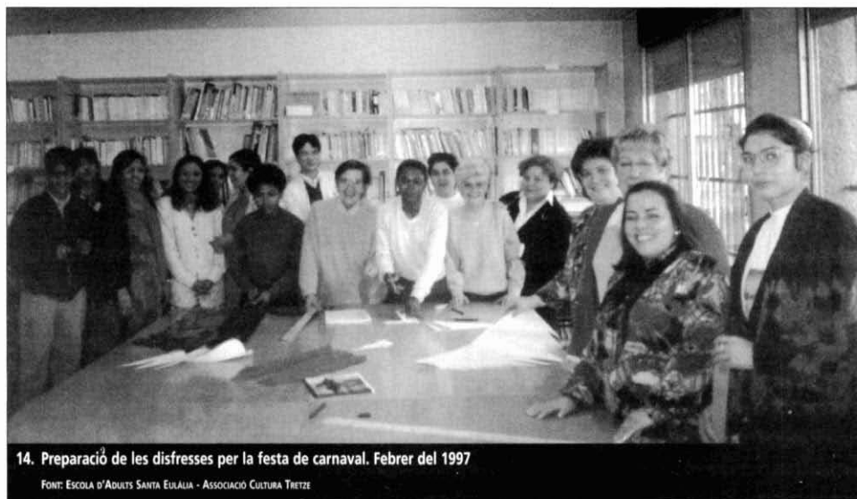
14. Preparació de les disfresses per la festa de carnaval. Febrer del 1997