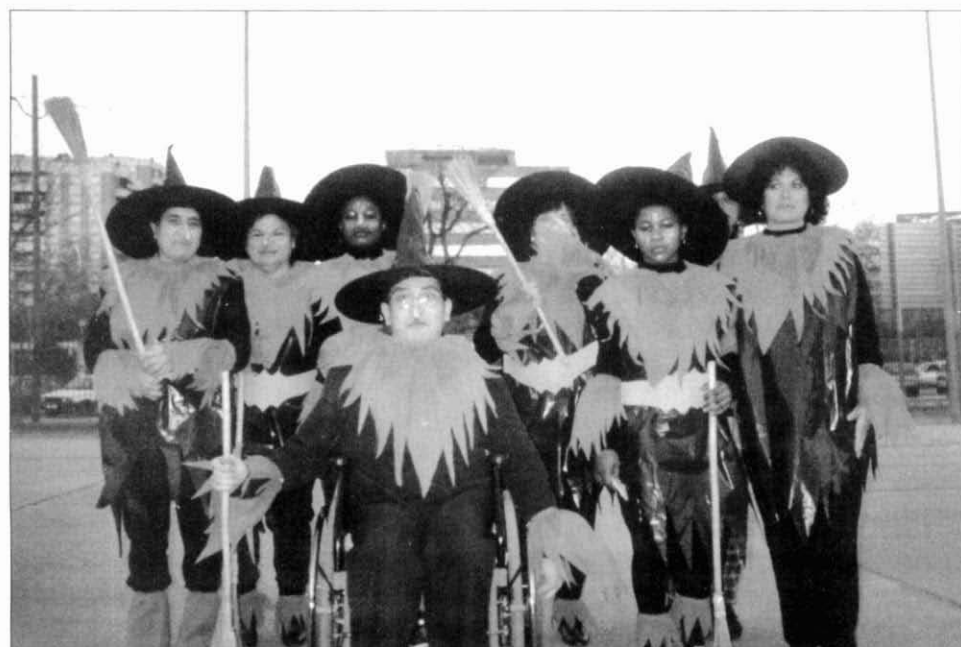
13. Festa de carnaval al pati de l'Escola d'Adults Santa Eulàlia, amb la participació de persones autòctones del barri i dels col·lectius indús, paquistanis, magribins i de Gàmbia.