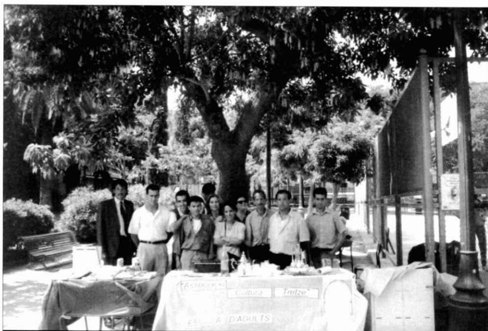
8. Participació a la Festa de la diversitat de l'Escola d'Adults Santa Eulàlia i Associació Cultura Tretze. Aquesta Festa està organitzada per la Comissió de Festes Collblanc-la Torrassa, 1996