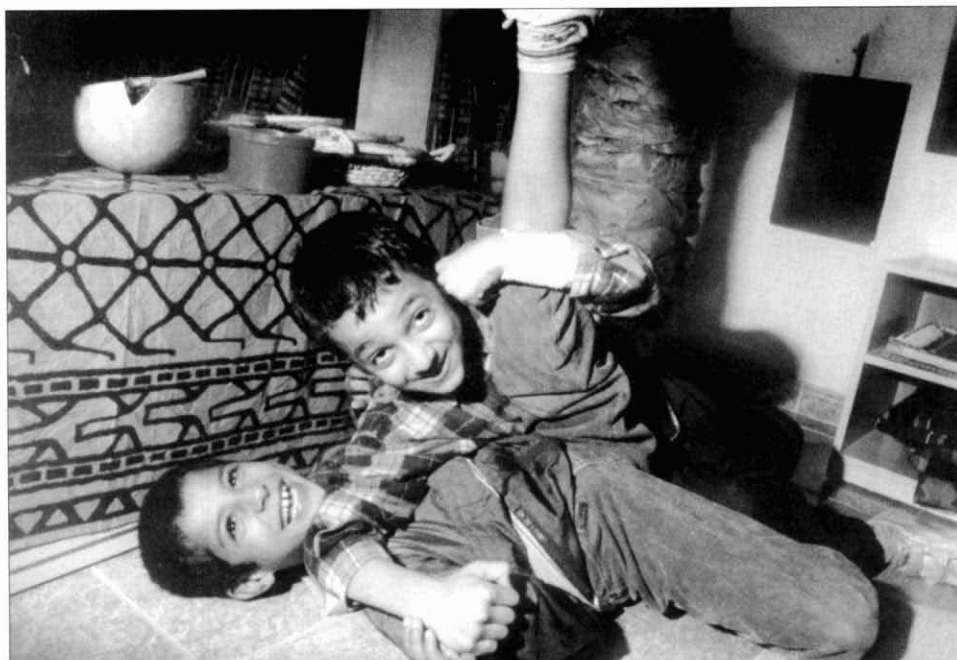
5. Dos nens magribins jugant a la ludoteca de la Fundació Akwaba.