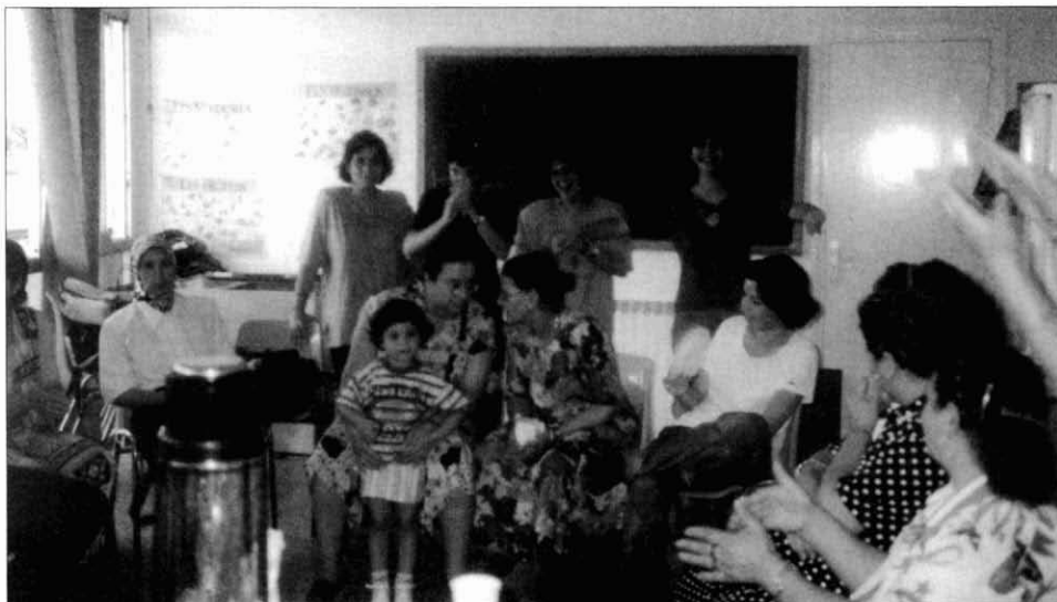
1. Grup d'alfabetització de dones magribines a una aula del local de la Fundació Akwaba. 1995