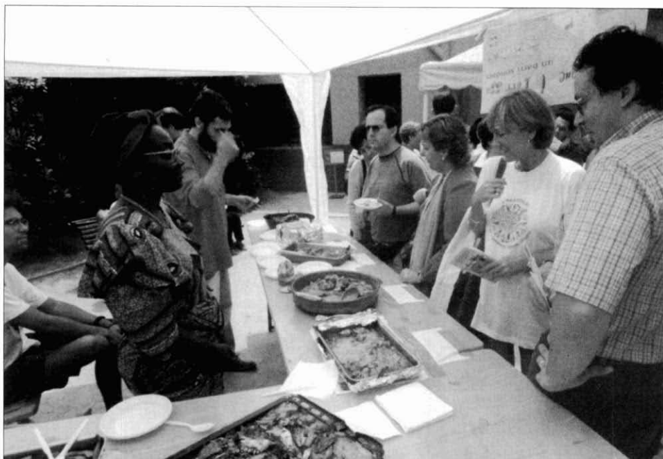
10. Mostra gastronòmica guineana (ètnia fang) a la Festa de la diversitat.