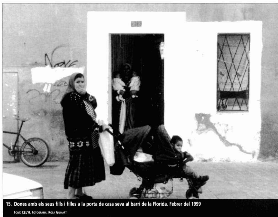
15. Dones amb els seus fills i filles a la porta de casa seva al barri de la Florida. Febrer del 1999