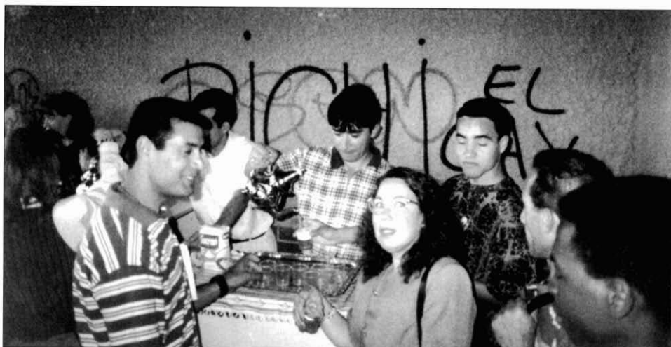
7. Festa del te. Homes i dones magribins, paquistanis i sudafricans, prenent pastes i te marroquins en una trobada que commemora la tradicional festa del xai. Juny 1997