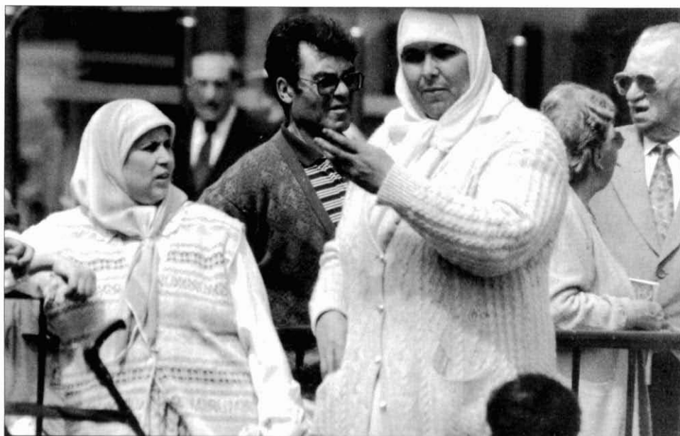
11. En el context d'activitats de difusió de la Fundació Akwaba, trobada a la plaça del Mercat de Collblanc. Primavera del 1996