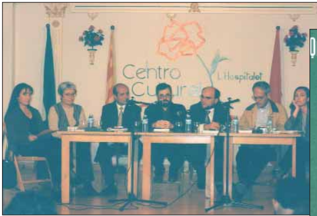
Presentació al Centre Cultural Claveles de la Florida del número 16 de Quaderns d'Estudi .