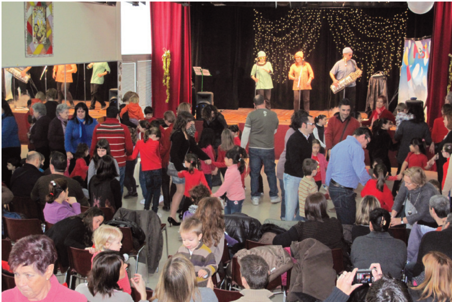
Activitat infantil organitzada per l'AVIC, any 2010.