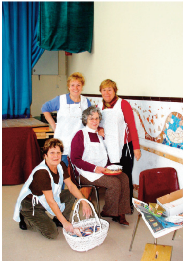
Les participants en el taller de trencadís van decorar la sala gran del local social l'any 2003.

L'AVIC va continuar amb les seves activitats socials i, fins i tot, en va recuperar alguna com el Concurs de Flors i Plantes. També va poder acollir, gràcies al nou local, representacions teatrals. La Vocalia de Dones organitzava tallers i activitats puntuals, com ara excursions i xerrades de temes d'actualitat. Per la seva banda, la Comissió de Festes desenvolupava un cicle festiu anual amb Carnestoltes, Sant Jordi, Festa Major, castanyada i Nadal. En algunes d'aquestes festes ambdues entitats col·laboraven, com ara fent activitats dins de la Festa Major, per la Marató de TV3, etc.