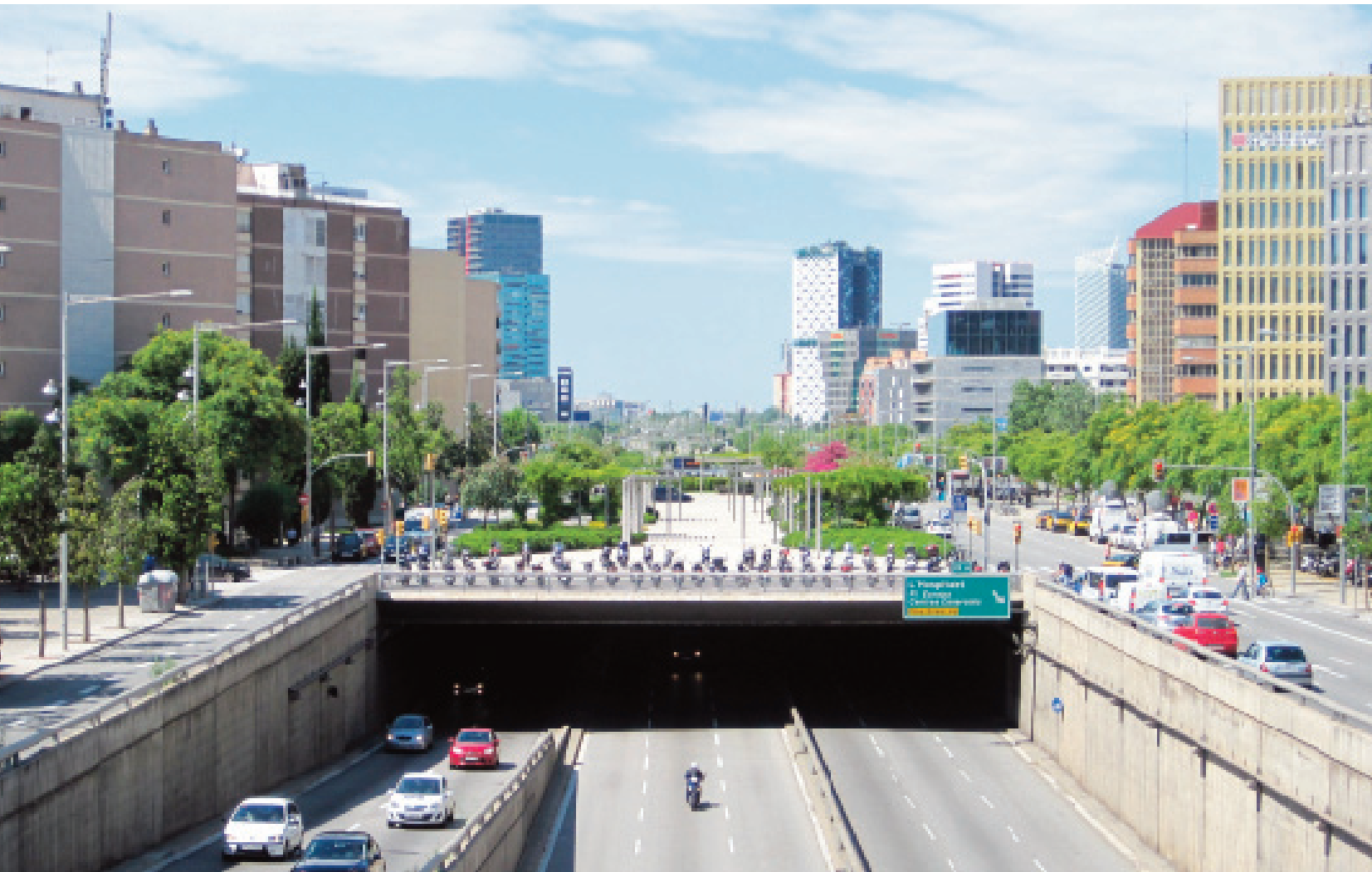
La Granvia des de la Plaça Cerdà, l'any 2014. Al fons, els gratacels de la Plaça Europa.

Aquests edificis i els que s'havien construït a la banda barcelonina del Carrer de l'Arquitectura (on conserva el nom tradicional, Carretera del Prat) van trencar l'aïllament que patia el barri des del seu naixement. Per primera vegada els habitants de Granvia Sud tenien veïns només en creuar un carrer, estaven totalment integrats en el teixit urbà.