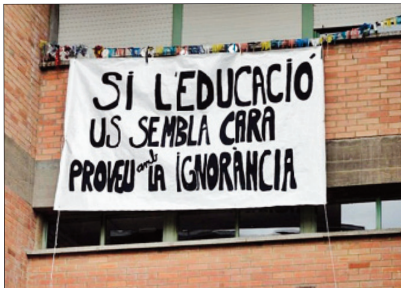
Des de l'Escola Frederic Mistral també es va lluitar contra les retallades en l'ensenyament públic. Fotografia de 2011.

L'any 2008, però, un grup d'alumnes de P3, majoritàriament de Santa Eulàlia, que no havien obtingut plaça on hi havien demanat,