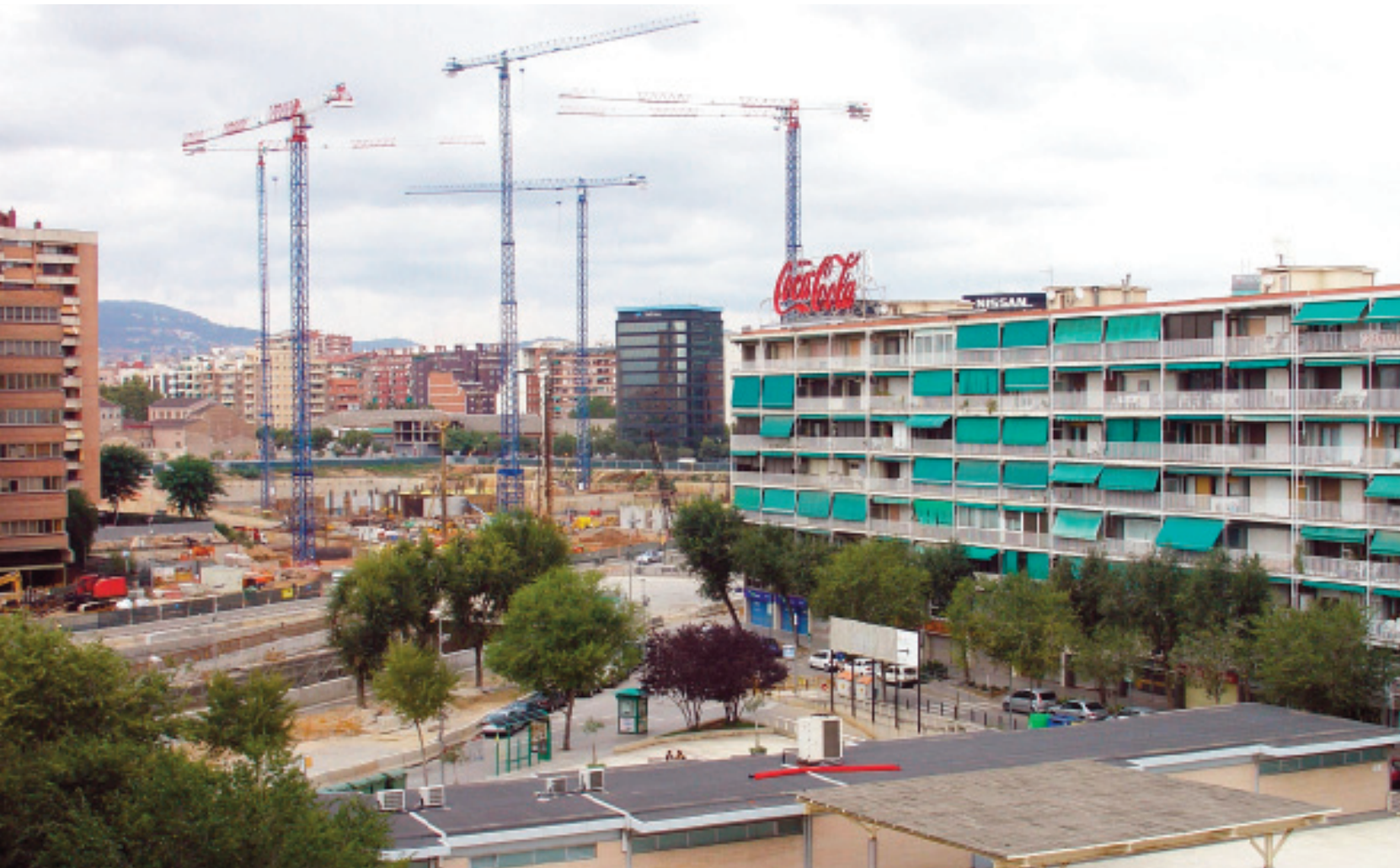
La Ciutat de la Justícia en construcció, l'any 2005.

joria de les famílies afectades va acceptar els nous habitatges que se'ls van proporcionar al bloc del carrer Ciències 10-18 (amb 60 pisos) i les cases dels carrers de Mileva Maric i Hanna Arendt. El trasllat definitiu, si més no fins el moment, fou el 2009. 2