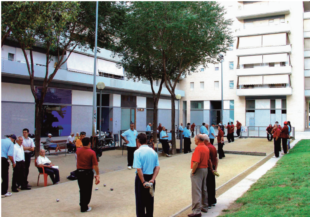
Les pistes de petanca al seu emplaçament anterior, a la Plaça dels Veïns, l'any 2011.

L'espai escollit, dels molt pocs que quedaven al barri, fou un terreny a tocar de la sortida de l'aparcament del Gran Via 2. El projecte fou aprovat l'any 2009 però va quedar aparcad per la manca d'un local proper a les noves pistes. El local social del barri, on tenien la seu, era una mica lluny i van demanar la concessió d'un espai propi i proper a les pistes: un petit local municipal buit que hi havia a prop, l'ús del qual els fou concedit el 2013. Aleshores es va executar el projecte de les noves pistes.