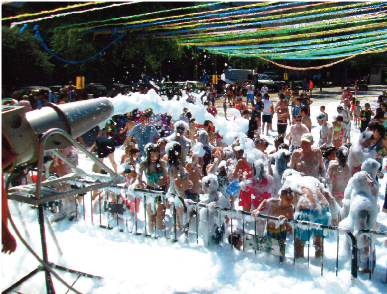
Festa Major de 2007.

quedar més remei que interposar una demanda al jutjat. Un any més tard, la sentència els va donar la raó, i les places tornaren a ser fixes.