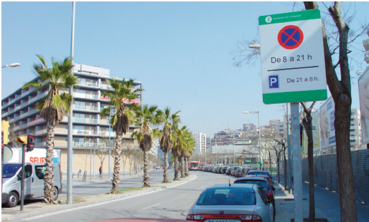
L'Antiga Carretera del Prat avui és un carrer del continu urbà entre Barcelona i l'Hospitalet, on es diu Carrer de l'Arquitectura. En aquesta imatge de 2009 veiem a l'esquerra l'últim dels blocs del barri.