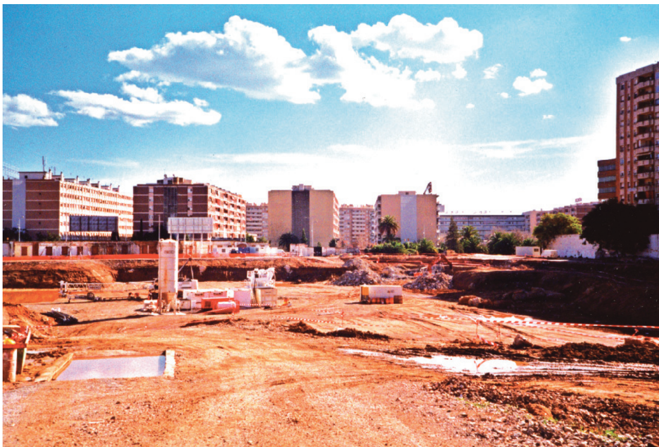
Granvia Sud vist des del solar on era la caserna de Lepant i on es comença a construir la Ciutat de la Justícia, l'any 2004.

Tanmateix, aquests acords oficials han estat percebuts com un gran èxit, com el reconeixement definitiu de l'existència d'un barri, que durant molt de temps es va sentir aïllat i oblidat, al que se li negava fins i tot el seu nom.