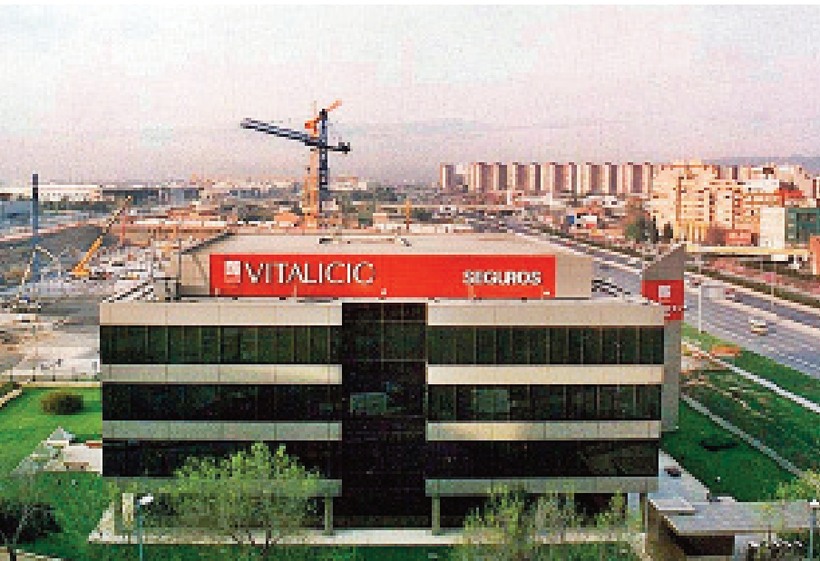
La Granvia, l'edifici de la companyia d'assegurances i el centre comercial en construcció, l'any 2001.