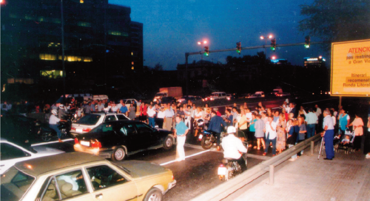
100 Tall de la Granvia amb motiu d'una manifestació, l'any 1993.

el lloguer dels pisos que estaven en aquest règim. Mentre es resolva el judici, que finalment van guanyar, les famílies afectades ingressaven la quantitat que consideraven correcta en un compte, que va arribar a superar el milió de ptes.