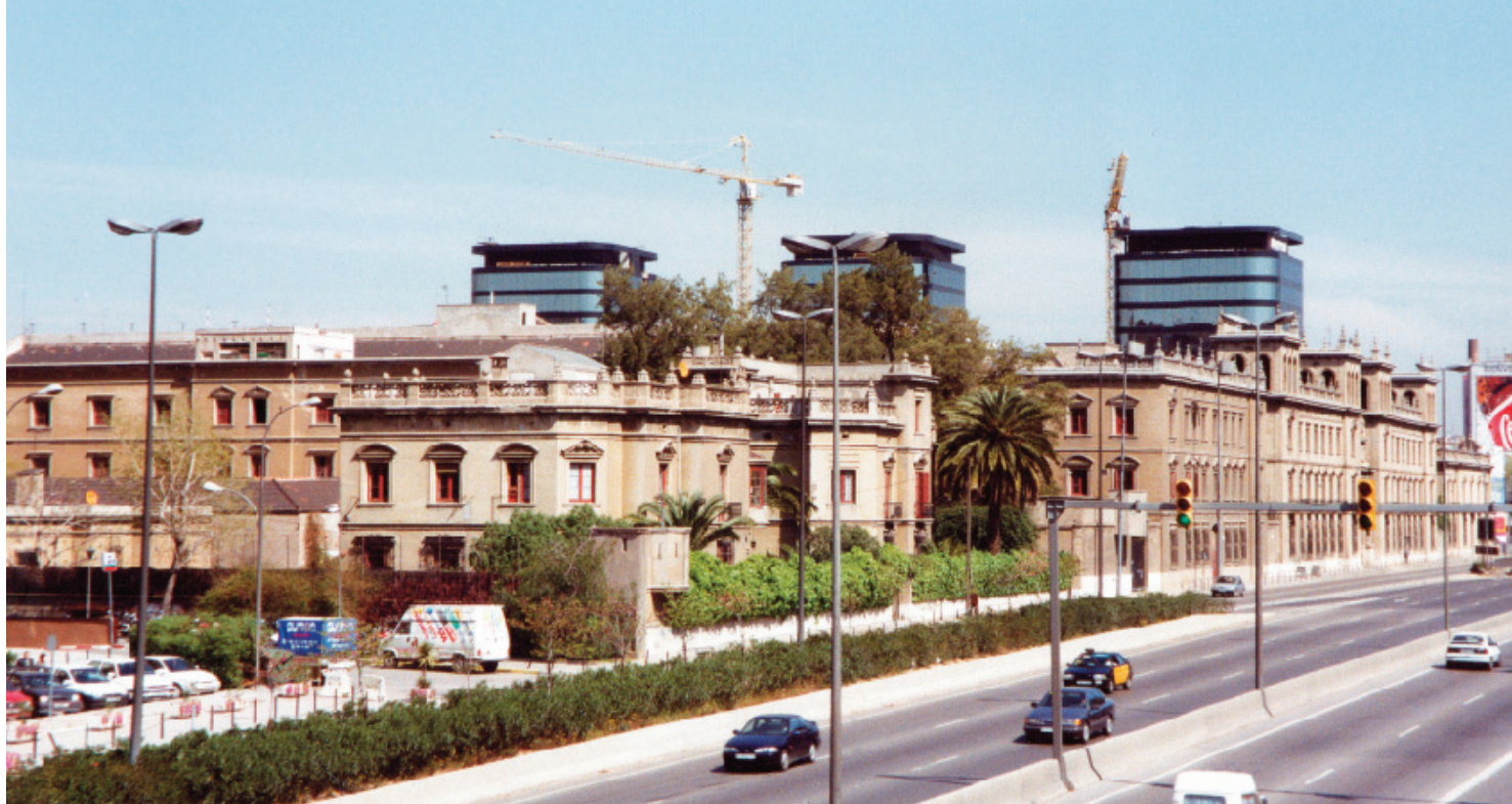
La Granvia i la Caserna de Lepant el 1995.

“Corbacho se ha mostrado abierto a cualquier posibilidad —”excepto una cárcel”—, siempre que sea un equipamiento que sirva para dar calidad urbanística a la zona estratégica de la Gran Vía y pueda convertirse en un elemento emblemático de L’Hospitalet.” 15