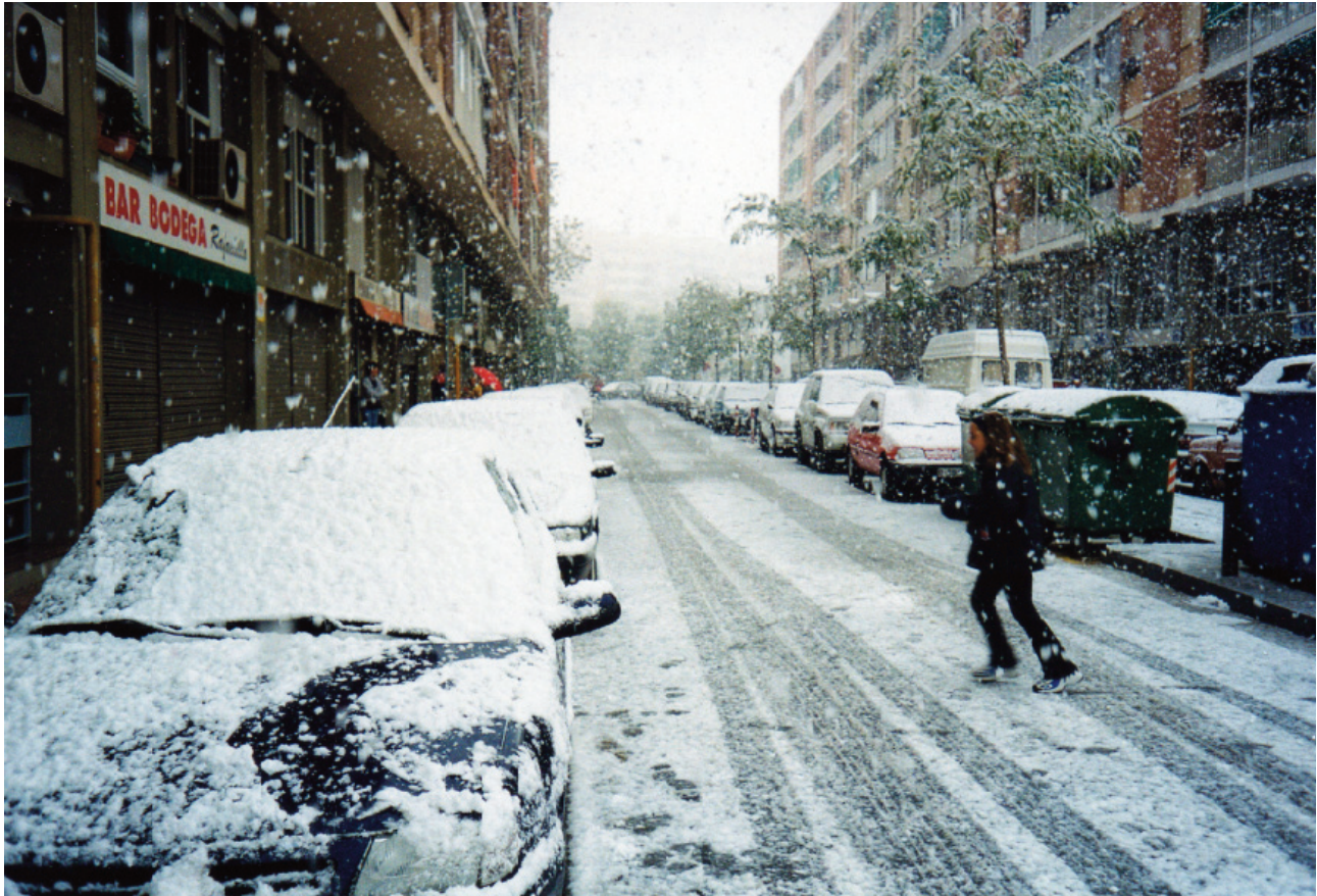
La nevada de novembre de 1999 va ser un sorprenent colofó a la dècada.