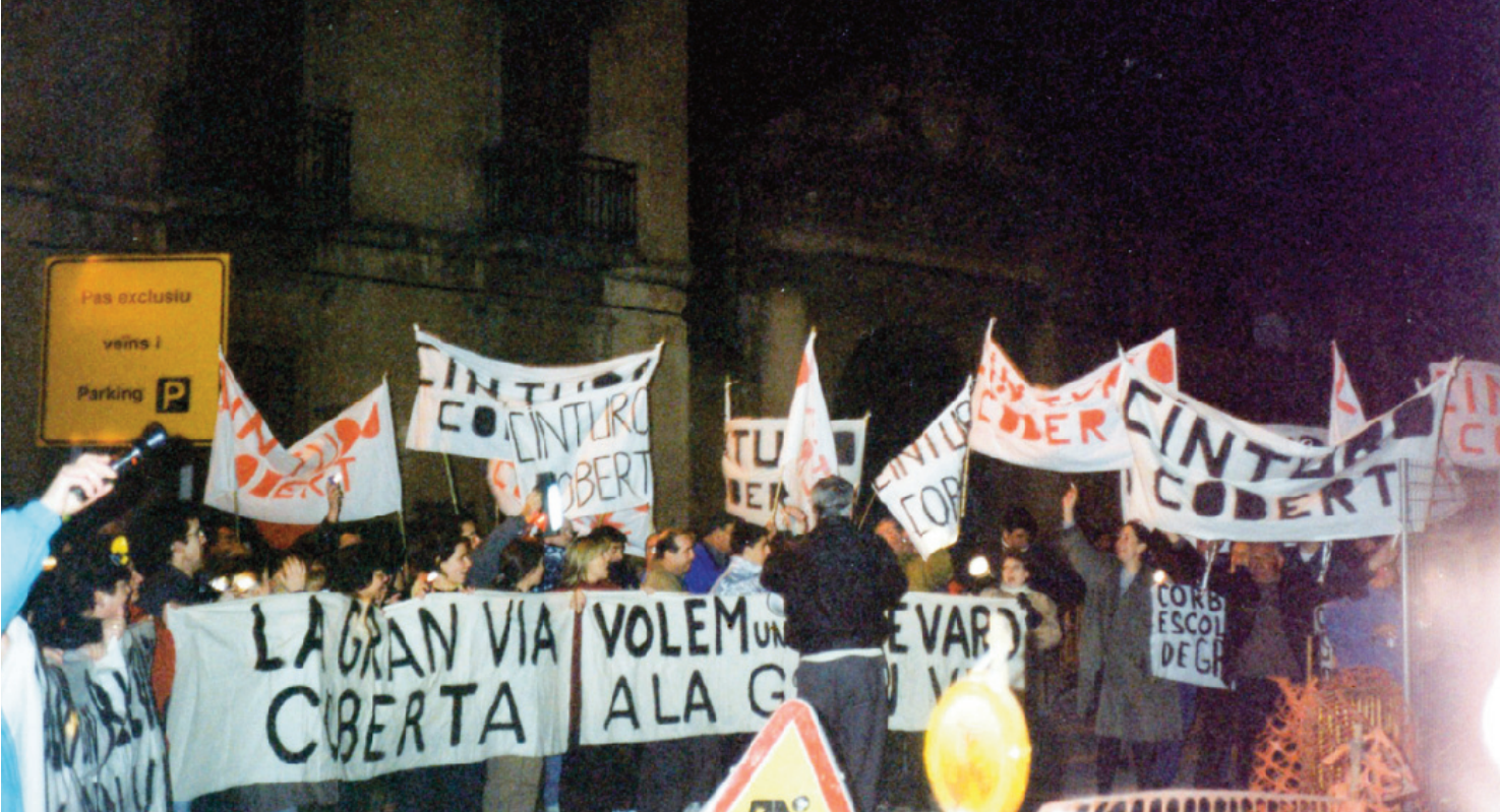
Manifestació a la Granvia, l'any 1998.

El “apartheid” de Granvia Sud, en el que deia: