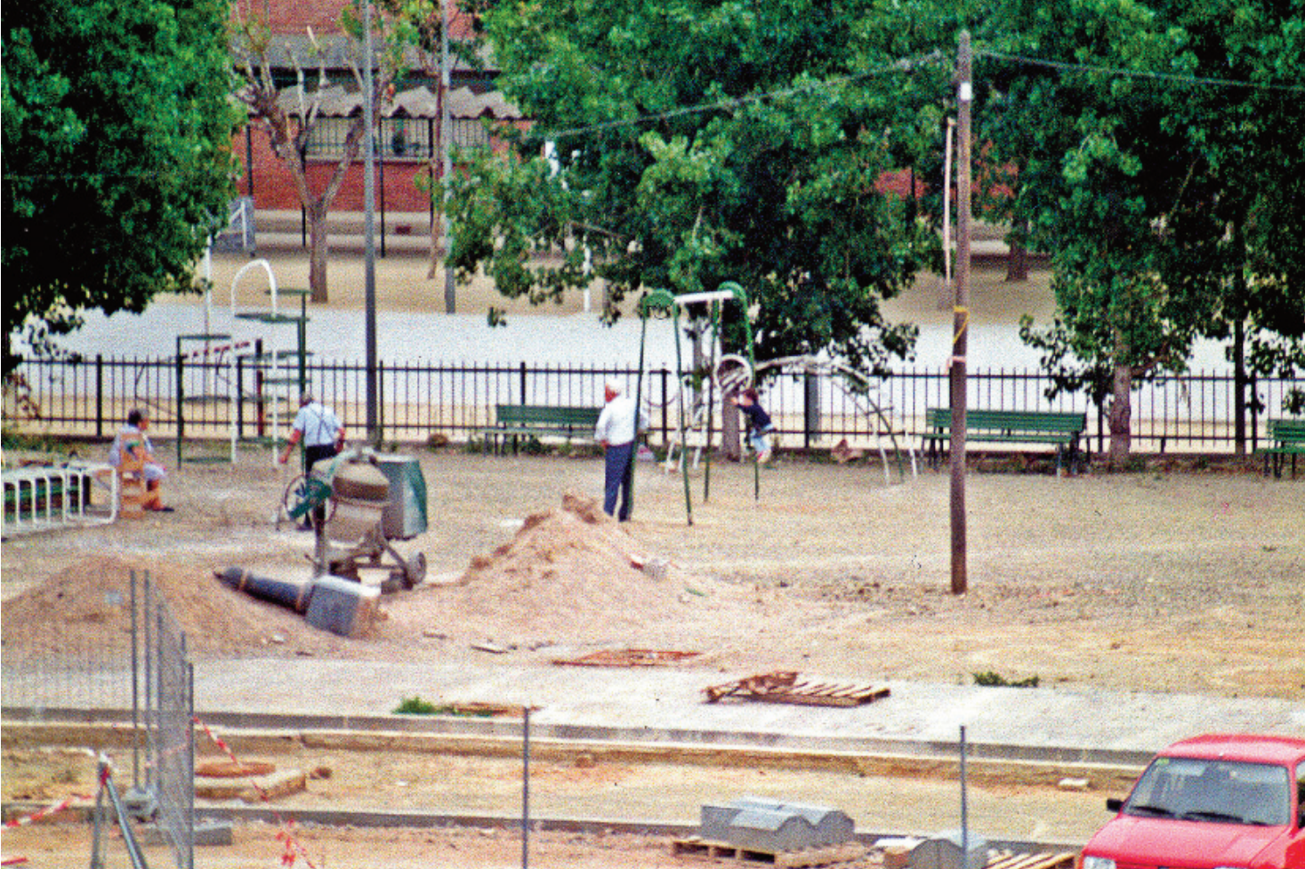
Obres als voltants de l'Escola Frederic Mistral, l'any 1995.

conquerir l'espai, augmentar la escarransida quantitat d'arbres del barri i fer una activitat educativa. També s'hi incorporaren unes antigues rodes de molí que feien servir a la fàbrica de cartrons de Can Renom, que havia estat allà mateix. Finalment es va consolidar el parc que encara gaudim.