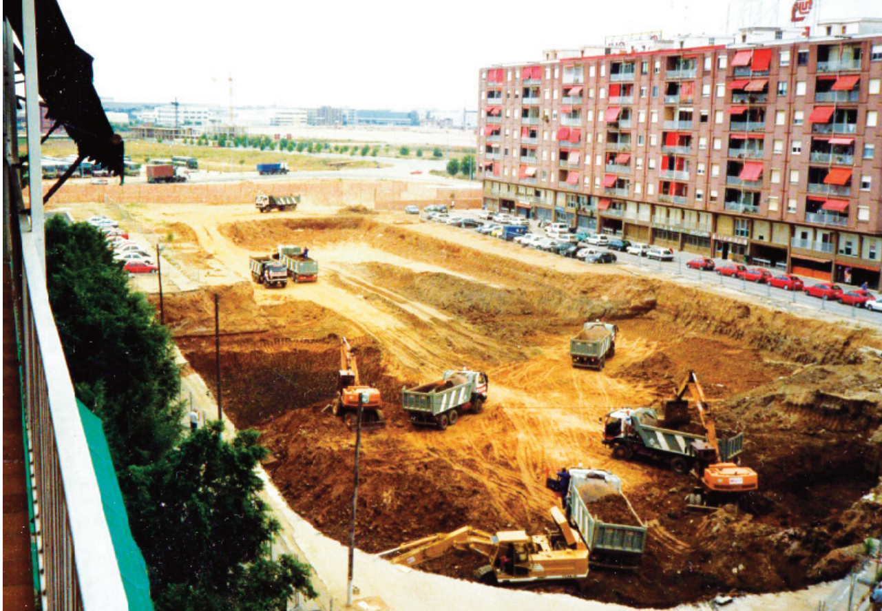
Començament de les obres de l'aparcament de la Plaça dels Veïns, l'any 1994.

Finalment l'Ajuntament es va sumar als pactes i els va donar la definitiva empenta administrativa. Per exemple, per poder construir el local social a la Plaça dels Veïns, a sobre de l'aparcament, calia una modificació en el planejament vigent. Precisament, la primera concreció de la segona tongada d'obres al barri fou l'aparcament de la Plaça dels Veïns, que es va començar a construir el 1993. Era la primera edificació que es feia des del 1971, o 1974 si comptem l'escola.