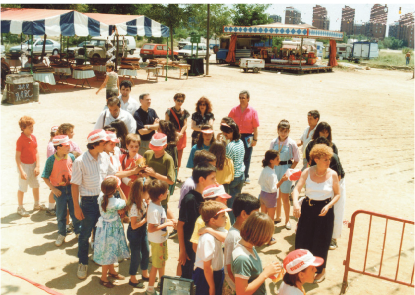
Activitats per a la canalla a la Festa Major de 1992.

tenien una forta presència de grups polítics procedents de l'antic PSUC, el partit que havia estat hegemònic en els moviments socials: el mateix PSUC, el PCC, Iniciativa per Catalunya, etc. És un tema que requereix un estudi en profunditat.