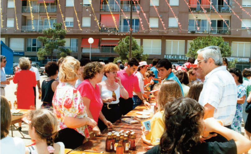
Aperitiu al carrer a la Festa Major de 1992.