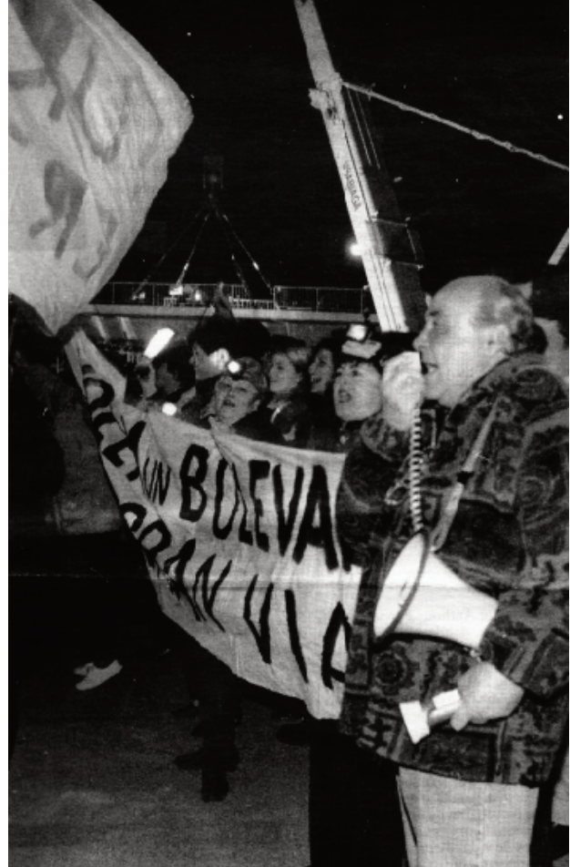
Un dels talls de la Granvia demanant la reducció de carrils i el cobriment de l'avinguda.

—“Aquesta dècada, els anys 90, es pot dir la dècada de les obres.