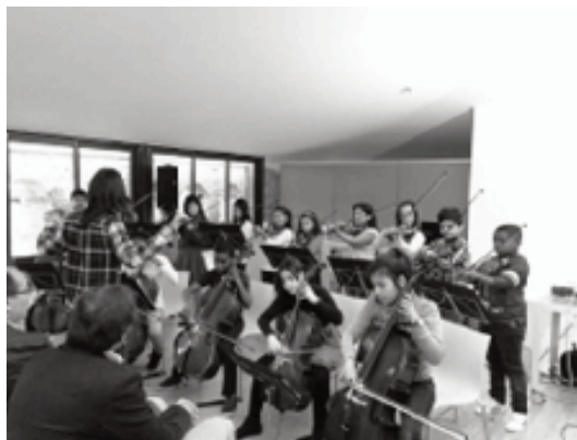
Alumnes de l'EMCA fent un concert

una seixantena d'entitats i més de 1.200 alumnes de la ciutat cada curs ja és una dimensió important per poder avaluar aquesta activitat educativa que s'ha desenvolupat en els darrers anys.