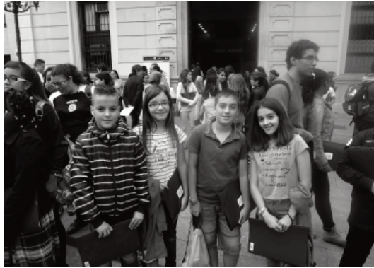
Noies i nois a la porta de l'Ajuntament, després d'un plenari del Consell de Noies i Nois

mària s'han fet pintades de jocs tradicionals al carrer; propostes per a les festes majors dels barris; accions de millora de l'accessibilitat i la mobilitat a la ciutat; campanyes de difusió del transport públic, la millora de la salut i la no violència a l'esport. Així com propostes per millorar l'oferta del museu de l'Hospitalet per als infants.