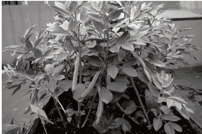
L'hort dóna els seus fruits