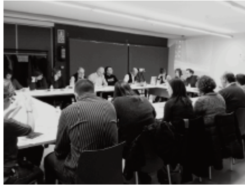
Una reunió del grup territorial de l'ApS de l'Hospitalet de Llobregat

metodologia innovadora totes les parts implicades, i això permetia que l'alumnat fes un aprenentatge significatiu, és a dir, que desenvolupés les capacitats i habilitats de totes les competències mentre feia algun servei a la comunitat de l'entorn més immediat en un espai i/o horari extraescolar, o no (gent gran de residències, persones dels centres de dia, persones amb algun tipus de minusvalideses, companys d'altres nivells educatius o d'altres centres, intervenció en accions d'espais i paisatges —la llera o el delta del Llobregat— propers al centre, etc.). Una metodologia que lliga un àmbit formal, el currículum acadèmic (que pot i s'ha de reflectir en els resultats), però en un nou escenari menys formal o extraescolar del servei a les persones de la nostra comunitat, de manera que l'alumnat aprèn defugint les classes magistrals amb el benestar de sentir-se útil ajudant els altres o compartint el seu temps. Nogensmenys, cal esmentar la difusió per part del SE, a partir de diferents plataformes d'Internet com el correu electrònic, la web del Servei Educatiu, els blocs, etc., per exemple, de les Jornades ApS de l'Hospitalet de Llobregat que el novembre d'aquest curs 2014/15 arribaran a la V edició a partir dels auspicis i propostes de la comissió permanent ApS (amb la col·laboració imprescindible d'una de les alma mater , Roser Batlle). 1 Aquestes jornades han estat pioneres a