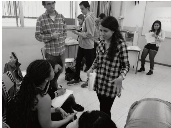
La Perla i d'altres companys del Rubió i Ors en plena acció amb alumnes d'ESADE

una marca emocional. Podem dir, sense por d'equivocar-nos, que el curs deixa una empremta diferent als joves que s'han implicat en un projecte d'aprenentatge servei.