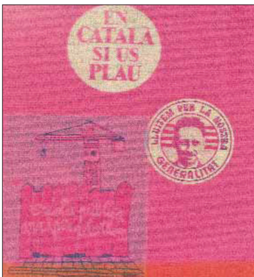
Enganxina del CEPEPC i dues més expressives de les lluites polítiques del moment