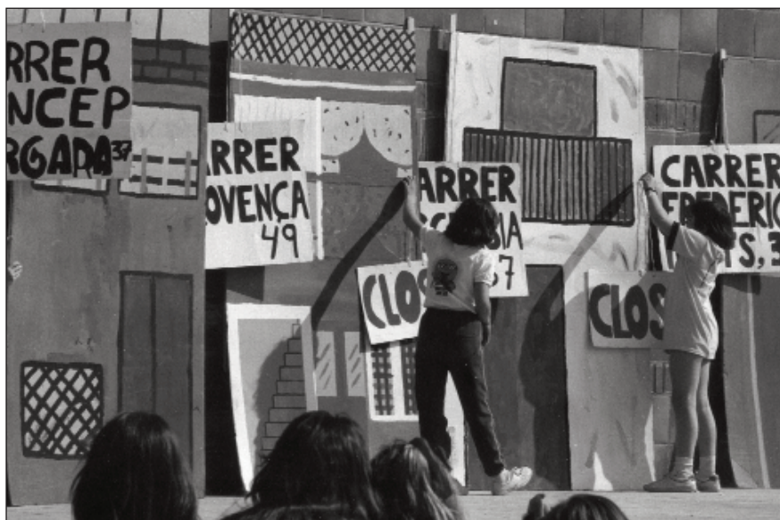
Un moment de la representació a Can Buxeres de La Història del Patufet. En escena tots els edificis que ens van donar aixopluc. Festa de l'escola en el seu 25è aniversari. Curs 1993-1994