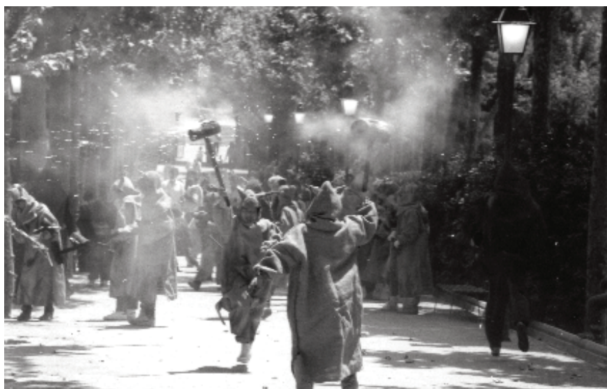
Bateig de la colla infantil de diables Patunyetes de l'escola a la festa a Can Buxeres per l'entrada a l'escola pública. Actuaren de padrins la colla de diables de Bellvitge, degana de la ciutat

tasques administratives les resolïa l'equip directiu. Val a dir que l'Ajuntament assumí, com a totes les escoles públiques, la consergeria. Això va implicar la qualificació de la secretària, tot i continuar fent funcions de secretaria, passà a ser de conserge.