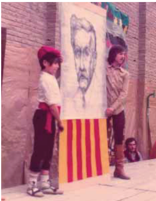
Festa dels 10 anys d'escola. Representació de la Història de Catalunya interpretada per alumnes de tots els nivells del Patufet al pati de l'escola.