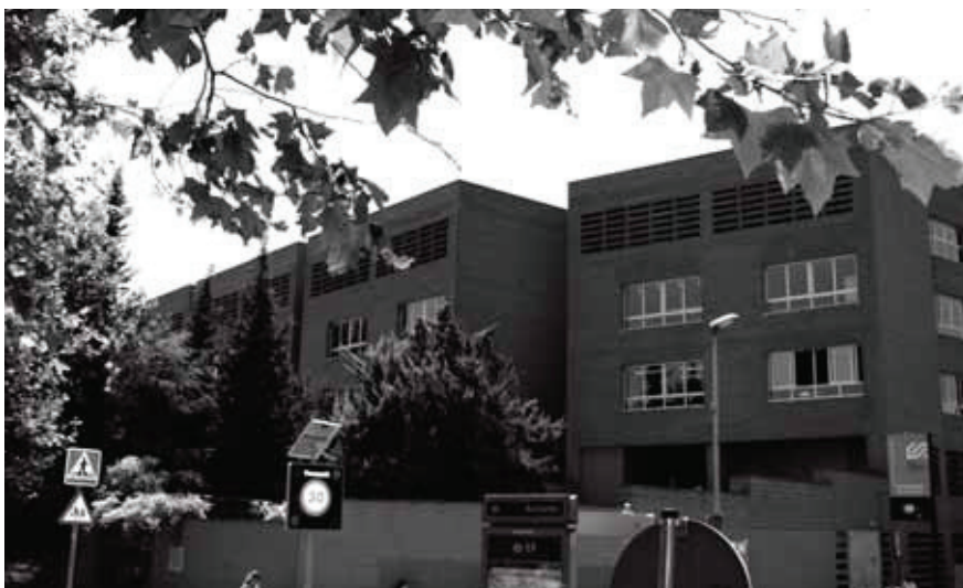
"L'escola nova"... l'escola pública amb el nom més llarg de Catalunya: Patufet-Sant Jordi, Francesc Batallé i Aragonès