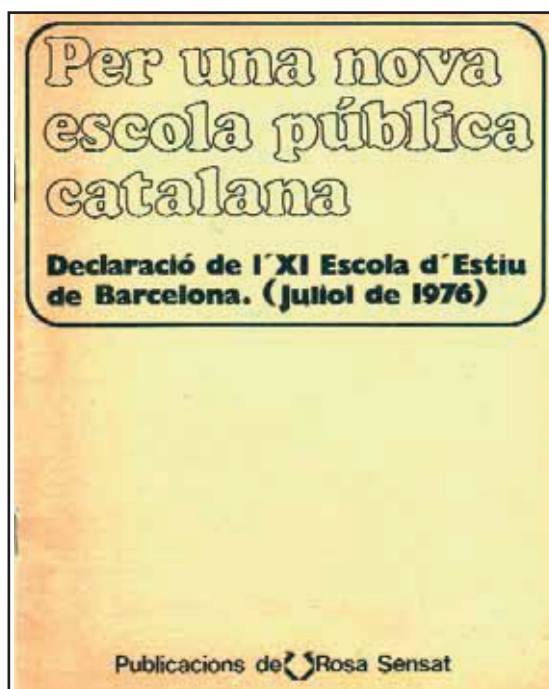
Portada de la Declaració de l'XI Escola d'Estiu de Barcelona. Juliol de 1976

La primera, la participació en la discussió dels documents de les escoles d'estiu de 1975 i 1976 esmentats, prenent un paper rellevant, sobretot en el del 1976, en encarregar-se de la moderació del grup de discussió que tractava de «l'Organització General del Sistema Educatiu». Aquesta discussió fou la que plantejà més dificultats, tant dins la mateixa escola d'estiu com posteriorment en la discussió política, que generà el document definitiu Per una nova escola pública catalana .