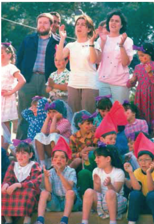
Festa del Patufet a Can Buxeres per celebrar l'entrada a l'escola pública, curs 1987-1988. Detall de pares, mestres i alumnes

És per això que hem dit que aquest pas no va ser exempt de situacions doloroses. No tothom va poder continuar, ja que l'escola estava en aquells moments per damunt de la ràtio de mestres de l'escola pública. Els mestres deixaren de pertànyer a la cooperativa per passar a ser funcionaris públics, mentre la cooperativa esdevingué de serveis per tal de garantir aquells que s'havien creat a l'escola al llarg dels anys: menjador, acolliment dels alumnes abans de l'hora d'entrada, activitats extraescolars, material escolar, etc. El personal administratiu no es preveia, ja que les