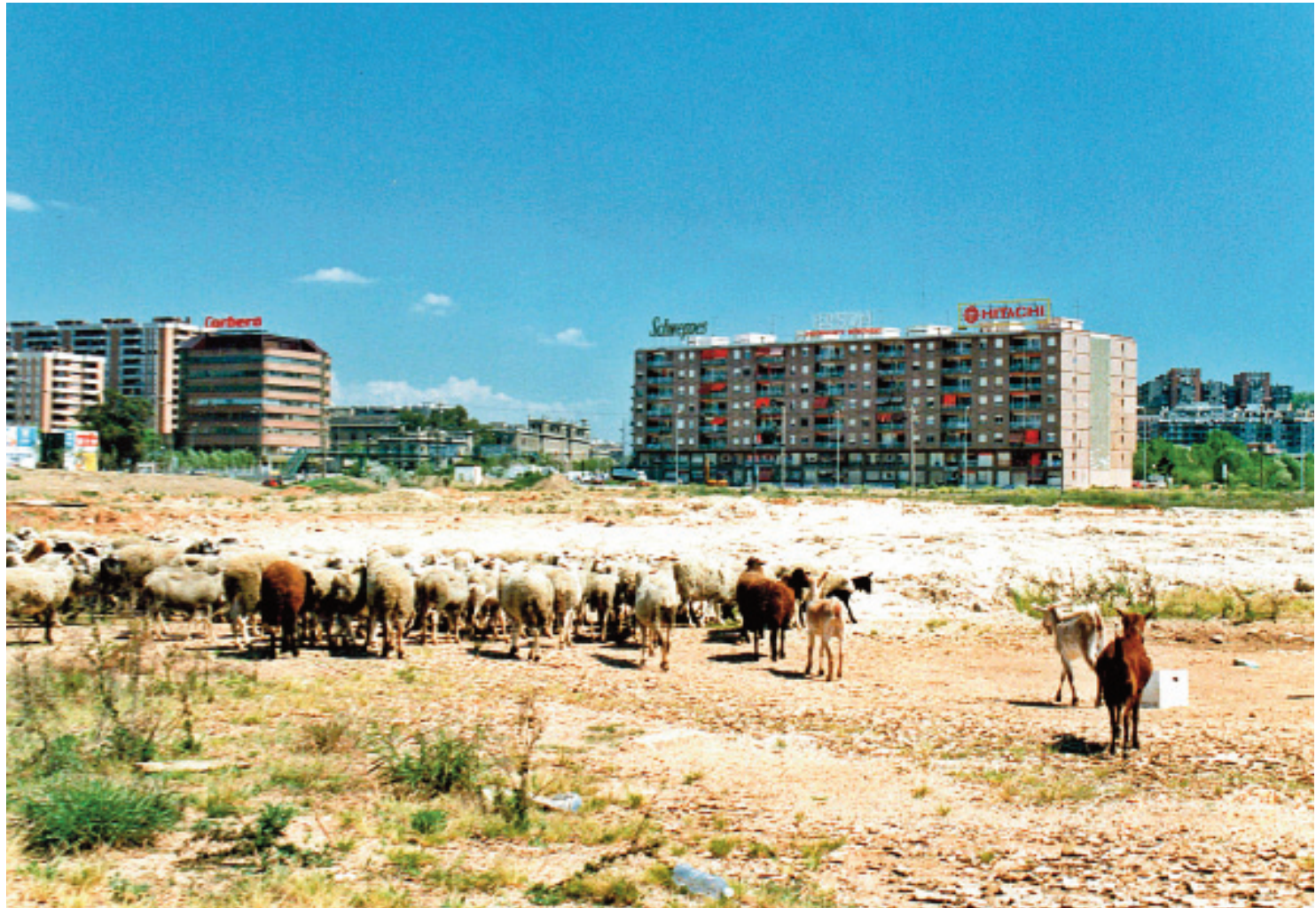
Una imatge del barri de l'any 1984.