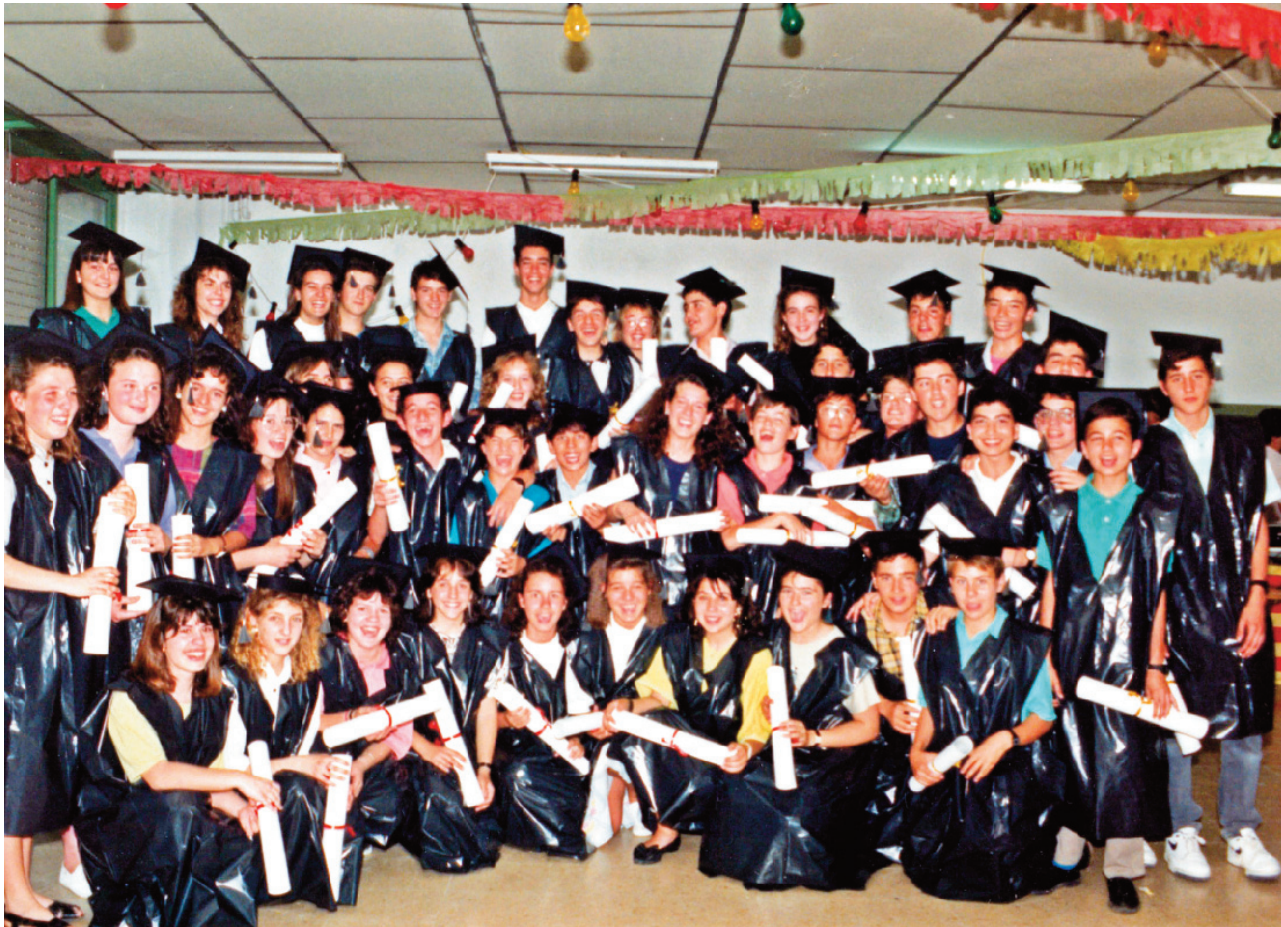
Festa de graduació de 8è d'EGB a l'escola Frederic Mistral, l'any 1989.

prés es va frenar molt. A la FAPAC vam saber que hi havia la proposta de fer d'aquesta escola un institut. Se'ls va fer la proposta i van dir que no.”