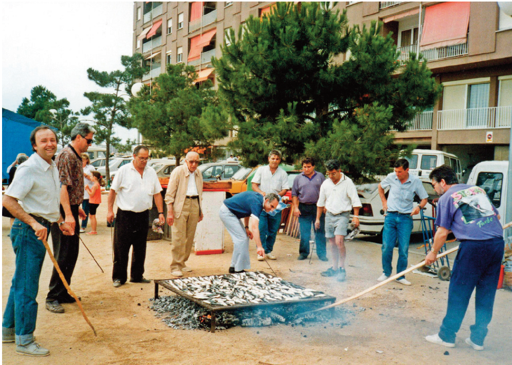
Festa major de 1987.