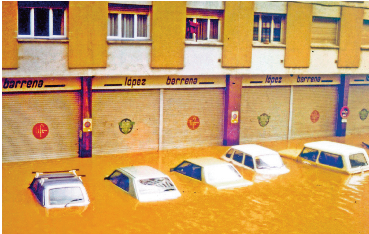
Inundacions de novembre de 1983.

evident incapacitat de les clavegueres i col·lectors per absorbir les pluges. Es va constatar que les canalitzacions que s'havien construït en el passat s'havien fet de forma insuficient o incorrecta, i fent servir les antigues sèquies del Canal de la Infanta. Tot plegat feia que anessin a parar al barri aigües que baixaven pel col·lector de la Riera Blanca. Les conseqüències concretes de l'episodi a Granvia Sud van ser la inundació dels baixos. Com ja hem comentat, l'editorial Planeta havia tingut un magatzem al bloc A. Com que ja s'havien produït algunes inundacions, aquesta empresa va convertir l'espai dels baixos en un aparcament i en va vendre les places als veïns. L'aigua va arribar a l'alçada dels volants. La declaració de zona catastròfica