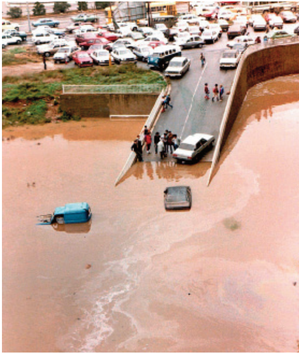
L'aparcament del Bloc F a les inundacions de 1983.