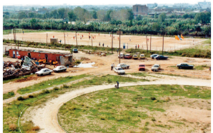
La pista d'atletisme i el camp de futbol.