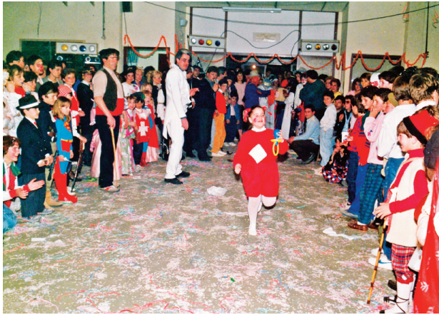
Festa de carnestoltes al gimnàs de l'escola Frederic Mistral, l'any 1987.