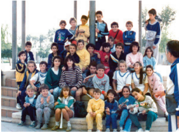
Foto de grup dels i de les components de l'equip d'atletisme de Granvia Sud.