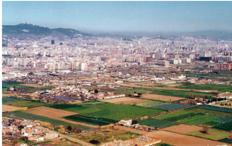
La Marina de l'Hospitalet el 1987. Al sud de la Granvia, tot i l'existència de Can Pi i d'altres nuclis edificats, dominava encara l'ús agrícola.

Finalment, davant d'aquestes actituds, les converses entre l'AVIC i l'empresa es van trencar. Més tard es van reprendre amb la participació de l'Ajuntament, amb motiu de