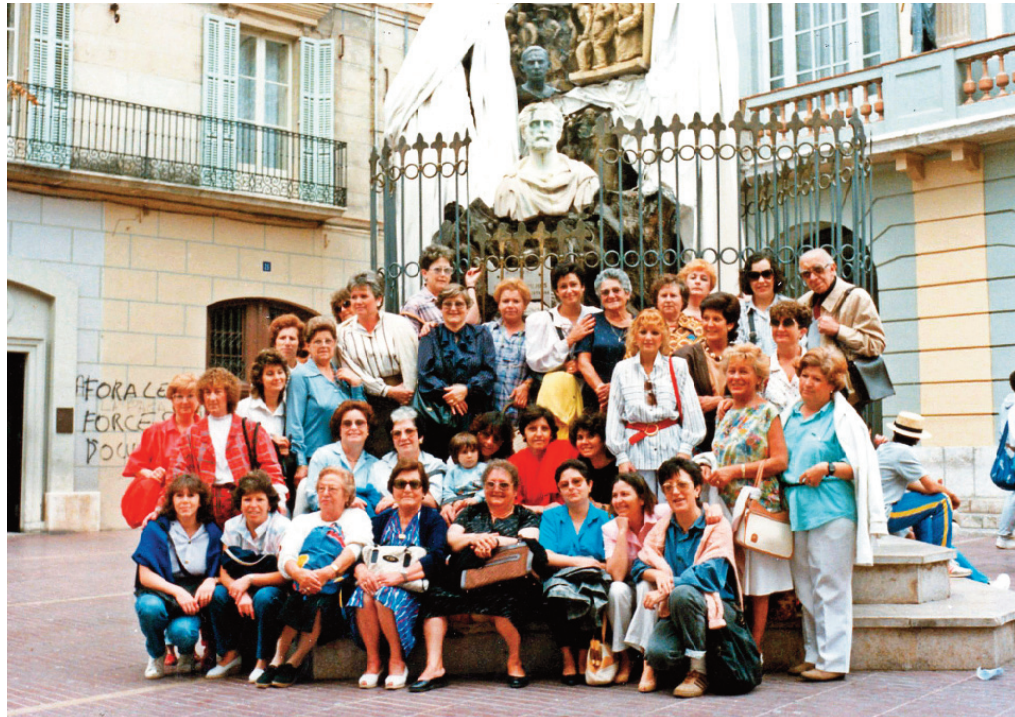
Excursió a Figueres organitzada per la Vocalia de dones de l'AVIC (1987).