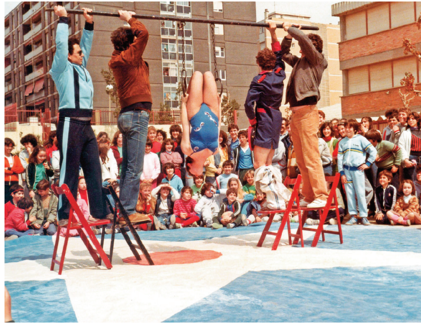
Activitat gimnàstica organitzada per l'AMPA de l'Escola Frederic Mistral, l'any 1981. No es pot negar l'esforç perquè les noies i els nois fessin esport.

Per fer l'activitat esportiva, calia una instal·lació, una pista d'atletisme. Per aconseguir-la van contar amb la imprescindible col·laboració de l'encarregat de les terres i els estables d'en Balañá, que encara eren a l'ex-