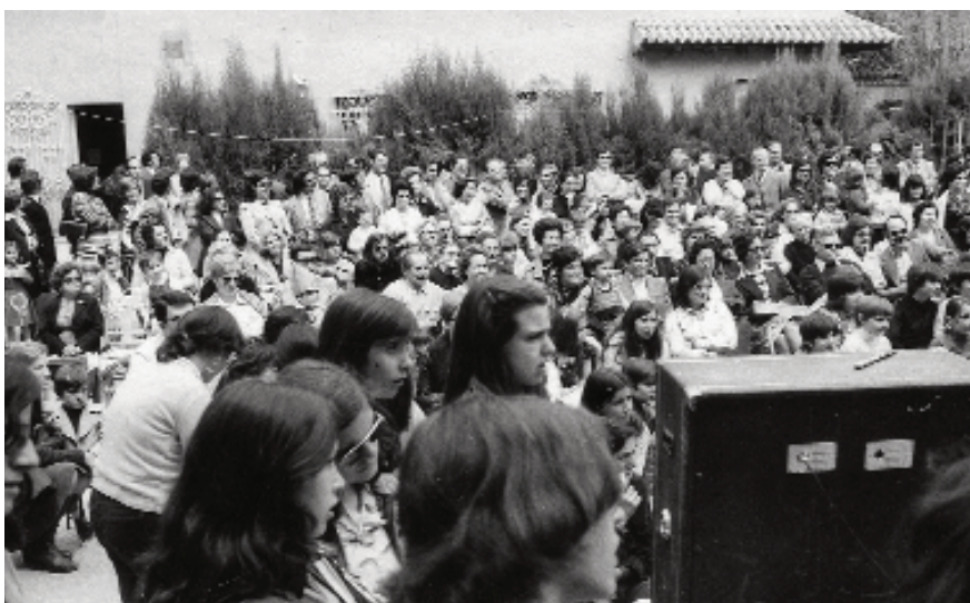
Ja tenim Pati! El curs 1971-1972 s'inaugurà l'edifici insígnia del Patufet dels primers quinze anys, el del carrer Príncep de Bergara, que amb un bon pati facilità les trobades de tota l'escola

relacions de l'Escola amb les administracions públiques: la municipal primer, com a administració més propera; l'estatal, el Ministeri, que tenia encara totes les competències en educació, i, finalment, l'autonòmica, quan ja va tenir les competències (1978).