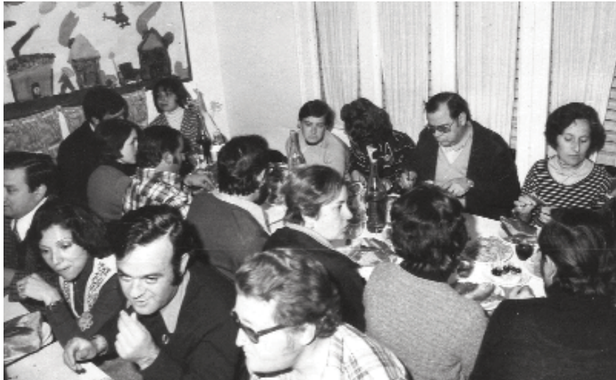
Primera trobada de pares al nou edifici de Príncep de Bergara. Curs 1971-1972

Un dels motius, tal com ja hem dit, era, per una banda, la manca de places escolars i, per altra, la manca de qualitat de l'escola pública. Ja s'ha parlat de l'acció de l'Associació de Veïns de Bellvitge, que es materialitzà amb la creació de la Guarderia Tintin, però també cal ressenyar que una de les primeres accions que dugué a terme l'Associació de Veïns de Can Vidalet fou la publicació d'un butlletí, el primer número del qual s'obria amb un article reivindicatiu sobre el problema escolar del barri, o que l'any 1976 l'actiu i emblemàtic Centre Social de la Florida editava un dossier sobre ensenyament en el qual s'analitzava la problemàtica i s'exposaven també les reivindicacions del seu barri. 13