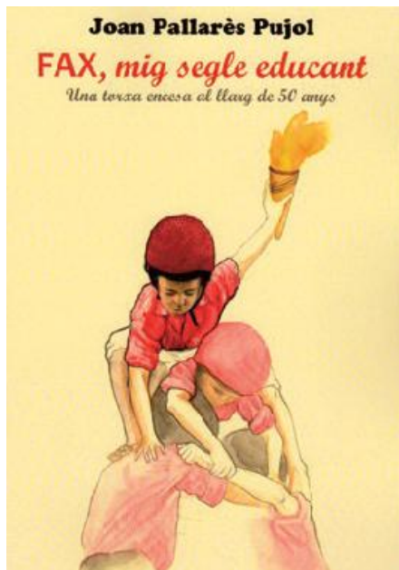
Llibre dels 50 anys, Escola FAX, 2015.