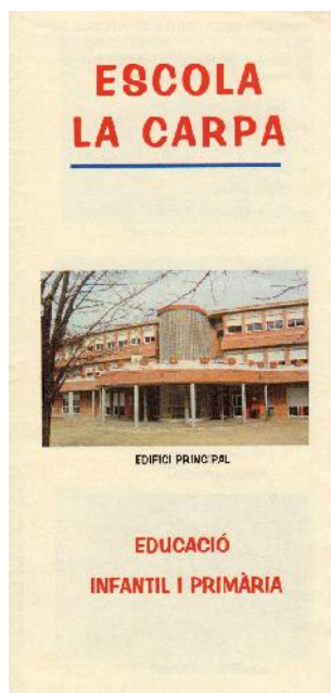
Díptic informatiu escola La Carpa.

l'Ajuntament, tantes nits enderrocant les tanques, fins a aconseguir que aquells 13 blocs que segons les immobiliàries havien d'anar en aquest espai es convertissin en un mercat, una bella escola i una plaça pública on se situa el primer aparcament subterrani del barri. Fou l'última de les escoles, però "és la icona, la bandera del barri".