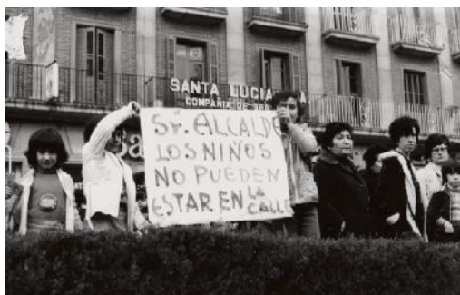
Reclamant escoles davant de l’Ajuntament, 1977.

Ara és un centre que imparteix ESO i els batxillerats de Ciències i tecnologia i Humanitats i ciències socials, i treballa com a centre de suport de l’Institut Obert de Catalunya. Però des de 1968, la societat ha canviat molt, l’educació també i l’institut s’ha esforçat a adaptar-se a les necessitats actuals.