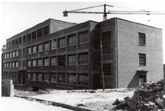
Construcció Institut Torras i Bages, 1968 AMH. Autor: Juan Ciuret