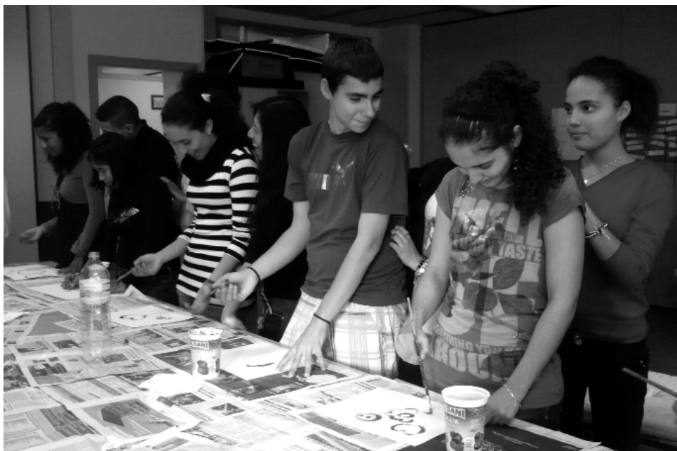
Els joves aprenen recursos pels infants dins del projecte Joves pel barri

Des de l'inici del treball conjunt i en vista dels bons resultats, creiem que el treball en xarxa entre entitats d'un mateix territori és la resposta més adient als reptes actuals.