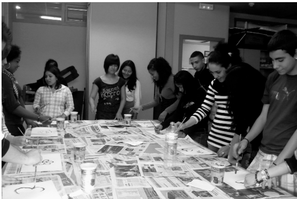
Una altra imatge de l'activitat del projecte organitzat a l'institut Ramon Fontserè

el desenvolupament de les seves tasques diàries: