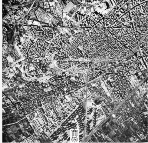
Ajuntament de L'Hospitalet de Llobregat

Portada d'El Llibre Blanc de l'Ensenyament a l'Hospitalet, que assajava la planificació escolar a la ciutat