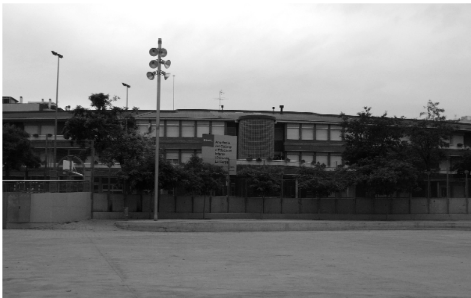
Una de les noves escoles instal·lades a Can Serra. L'escola la Carpa.