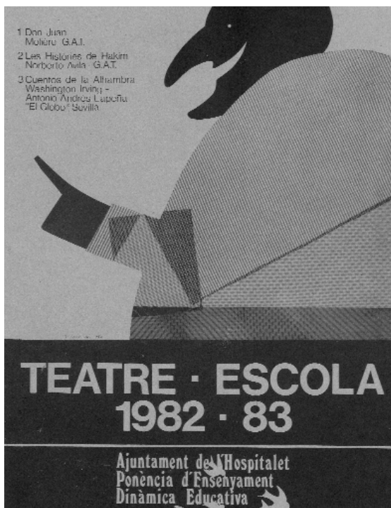
Portada del fullet de la campanya de teatre-escola 1982-1983, en col·laboració amb el Grup d'Acció Teatral (GAT) de l'Hospitalet

ment entre ciutat i escola. Es va promoure la presència de l'escola a la ciutat, sobretot a partir de la participació dels nens i nenes a les habituals festes de carrer pel Carnestoltes, les festes majors, Tots Sants, amb publicacions explicatives del sentit de cada una d'elles. Especialment treballada pels mestres era la Fira d'Hivern de les escoles a la rambla Just Oliveras, abans de Nadal, en la qual els alumnes oferien manualitats de caràcter nadalenc. I la presència de la ciutat a l'interior de escola, posant al servei de mestres i alumnes tant els equipaments propis de cultura, com museu, aules de cultura i biblioteques, com el coneixement que l'Ajuntament té de la ciutat en les diferents dimensions —econòmica, de producció i de consum, comercial, de seguretat, la xarxa de clavegueram, etc. Es difonia el concepte de ciutat com un ésser viu que rep aliments i consumeix energia, hi ha circulació de vida i punts neuràlgics i que, com tot ésser viu, ha d'eliminar residus. Eren actuacions pioneres que, posteriorment, han estat assumides pels centres de recursos de la Generalitat.