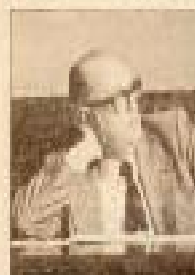
El alcalde, en plan derrochista (Polo Miquel)