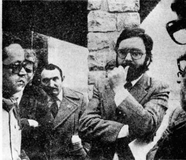
Narcís Serra escucha las explicaciones que le dan los miembros del Comité Unitario de Acción Municipal de Bellvitge. ¿Que soluciones pensaría el conseller socialista a los problemas del polígono?

Narcís Serra, primer conseller que pisa el barro de Bellvitge