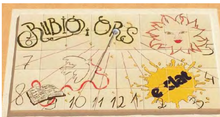
Detall del rellotge.