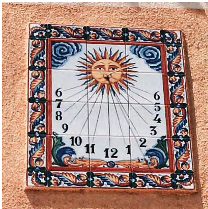
Detall del rellotge.