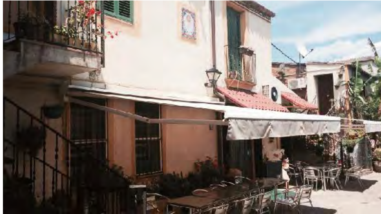
Façana sud de Cal Capellà en l'actualitat.

és aràbiga i està emmarcat amb motius florals policroms catalogat como rellotge d'autor. 49