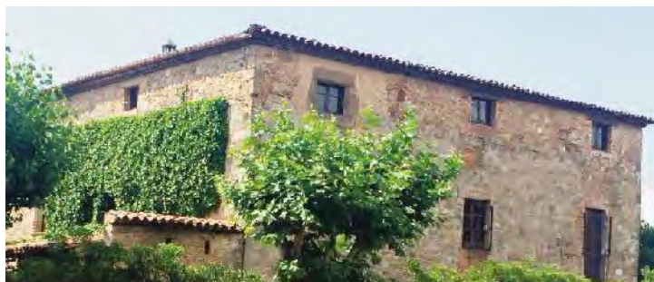
Estat actual de la masia.