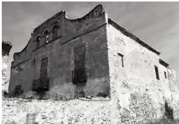
Estat actual de la masia.

Sota l'arqueria de tres finestres, ubicades al centre del carcer, es va descriure la existència d'un rellotge de tipus vertical i forma circular, extremadament deteriorat, amb el dibuix pràcticament desaparegut. 46 Segons la referència, el gnòmon havia