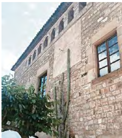
Rellotge a la façana SO.

Conserva un parell de rellotges molt visibles a les façanes SE i SO, de tipus vertical declinat quadrat, que han perdut les marques horàries, tot i que encara és visible l'arrebossat on devien estar pintades. El gnòmon de vareta disposa de suport en Y. 42