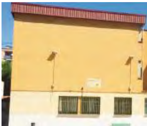
Façana sud-est de la escola.

Es tracta d'un rellotge rectangular realitzat amb rajoles ceràmiques, amb marques horàries de les 6 del matí a les 5 de la tarda, en cicles de 12 hores. La numeració és aràbiga i la línia de les 12 és vertical. En la decoració hi ha un sol, el nom de l'escola i una decoració artística amb els colors identificatius del centre i els noms dels alumnes del Centre l'Esclat i els de l'Institut, que van participar en l'estudi, disseny i construcció del rellotge sota la supervisió gnomònica d'I. Vilà. 51