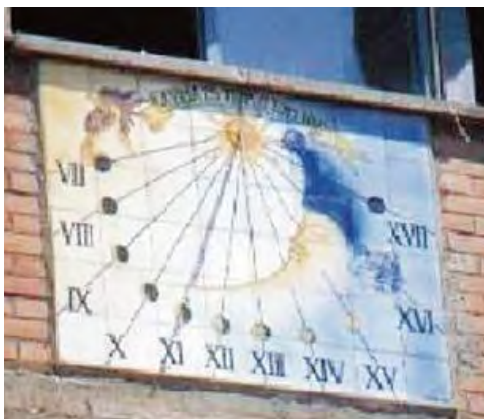
Detall del rellotge esmentat. Foto de J. Nogué.

Cap a 1989, un concurs realitzat entre els alumnes de l'Institut va propiciar el disseny d'un rellotge en ceràmica decorada amb el cap d'un gall a l'esquerra i a la dreta, la lluna i un cap de gat. Al pont hi havia un sol sobre el qual figurava el lema: "La vida és temps, el temps és vida". Al final de cada línia horària hi havia la lluna en una fase diferent i l'hora en números romans. Era del tipus vertical declinat, orientat al sud-est. El càlcul i disseny va ser obra de J. Manso SA de Barcelona. 52 La denominació actual del centre és Institut Europa i no hem pogut localitzar-lo, per la qual cosa creiem que ha desaparegut.