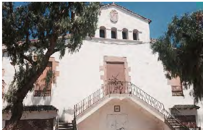
Façana principal.

Construït en pedra artificial i forma blasonada o en escut, presenta un frontó corbat a la part superior, imitant la volta celeste, que inclou cinc estrelles en relleu seguint el perímetre i un angelet amb les ales desplegades ocupant l'espai interior. La numeració, també en relleu, és romana i la vareta està declinada a llevant.