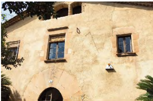
Façana principal del mas.

Del seu rellotge, només en queda la vareta, però s'intueix que es tractaria d'un rellotge vertical orientat a sud, del qual no podem precisar més per haver-se'n perdut el detall arquitectònic.