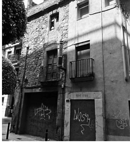
Façana actual dels edificis del carrer Major, 80 i 82.

Curiosament, en una fotografia de la dècada de 1920 en què es contempla el campanar i l'edifici principal, Luis V. Bagán aconsegueix apreciar l'existència d'un rellotge solar al campanar. 10 L'exemplar en qüestió era de tipus circular, declinat cap a llevant, i estava situat al primer cos de la torre prop de l'espai on s'ubicaven les campanes. 11