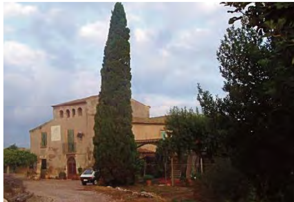
Aspecte actual del mas.