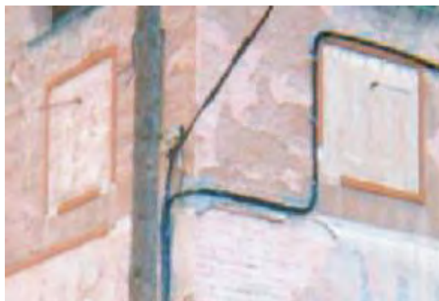
Aspecte dels dos rellotges desapareguts.