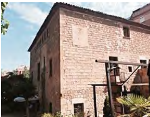
Rellotge a la façana SE.