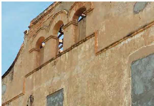
Detall de la vareta en el seu emplaçament original.

desaparegut un parell d'anys abans. Nosaltres només hem pogut constatar la presència de la vareta com a testimoni de la seva existència.