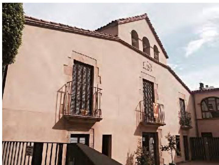
Façana actual de la masia.