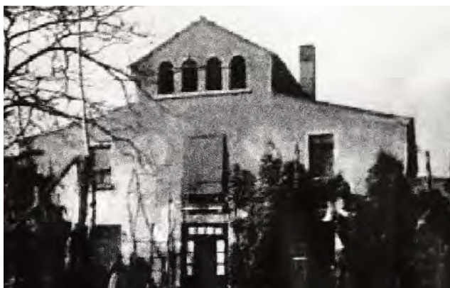
Font: web 35

Al Polígon Pedrosa, a la carretera antiga del Prat, s'ubica la masia coneguda com Cal Gotlla. L'edifici, de tipus basilical típic del segle XVII, correspon a la classificació II-3 de Danés i Torras, és a dir que els vessants de la teulada llencen les aigües cap a les façanes laterals.