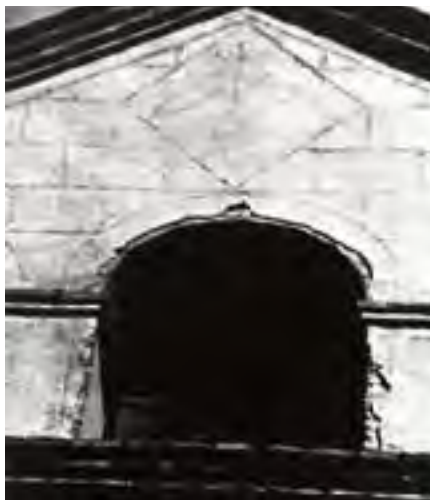
Vista del cos superior de la masia amb el rellotge.

En l'actualitat, després de la reforma realitzada a l'edifici i el seu entorn, ens trobem amb un rellotge artístic d'autor, ben conservat, que mostra numeració romana de les 6 del matí a les 4 de la tarda, en cicles de 12 hores, en hores astronòmiques amb gnòmon de vareta. No exhibeix cap tipus d'ornamentació ni línies de declinació. 38