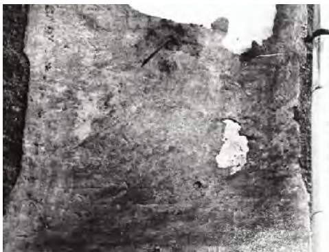
Font: Montgiel i Portolés (1985).

L'arrebossat s'ha perdut en part de la superfície. No es distingeixen les marques horàries, però semblen observar-se línies incises formant tres quadrats inscrits. Conservava la vareta doblegada cap avall.