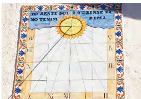
Detall del rellotge i el lema.