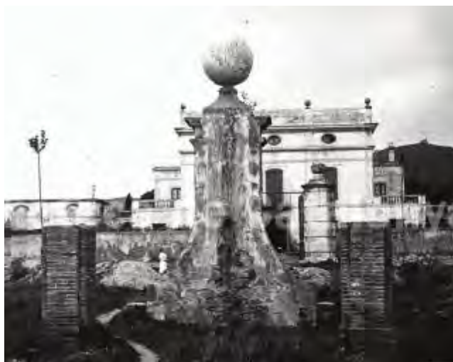
Font amb el rellotge esfèric al damunt.

La seva particularitat, la constitueix l'antiga font existent, coronada per una bola de gran diàmetre que feia les funcions de rellotge de sol esfèric. Quan hi batia el sol, la part que quedava a l'ombra assenyalava les hores. Hi havia una placa que recordava que era propietat dels Girona i els seus drets.