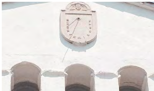
Detall del rellotge.