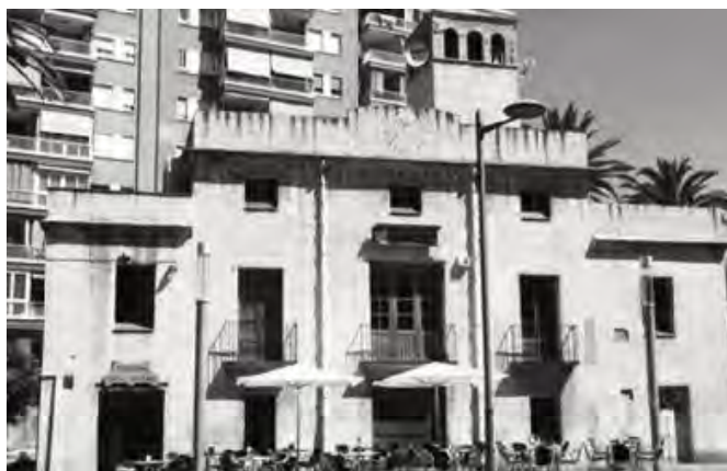
Façana actual de la masia Escorça.

El rellotge és del tipus circular esgrafiat en ciment amb cercle distribuïdor horari. La numeració de les hores és d'estil aràbic, de 5 del matí a 6 de la tarda, amb mitges hores incloses, en cicles de 12 hores. Vareta de recolzament doblegada cap a dalt. Presenta petites restes de coloració. 45 Segons F. Molina, sembla que només marcava bé les hores durant els mesos de juliol i agost.