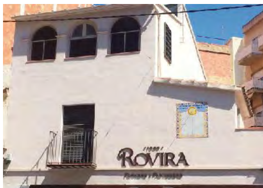
Façana actual de l'edifici.

Realitzat amb peces de rajola policroma, està orientat al sud. Té forma rectangular amb marques horàries cada hora des de les 7 del matí a les 5 de la tarda, en cicles de 12 hores, amb numeració romana. La línia de les 12 és vertical amb un sol al pol, emmarcat amb sanefes vegetals i el lema: "Jo sense sol i tu sense pa no tenim demà". 50