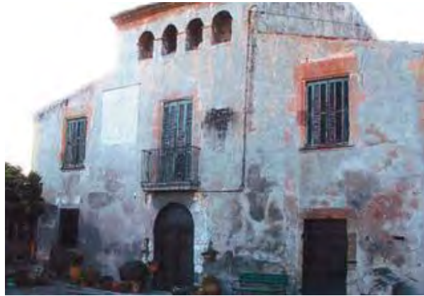
Façana principal de Can Trabal amb el vistós rellotge de sol que la presideix.