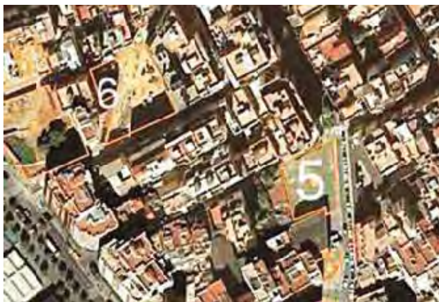
A la cantonada del núm. 5 és on s'ubicaven els rellotges esmentats. L'altra numeració visible a la fotografia fa esment d'edificis desapareguts en la mateixa època, dels quals només queden els solars.