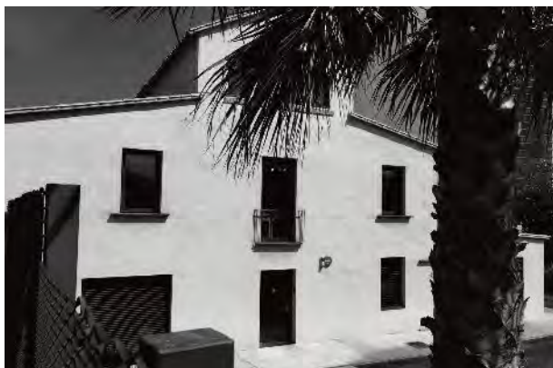
Façana actual de la masia, actual seu del Consorci de la Zona Franca.

Dels rellotges podem intuir que correspondrien a la tipologia dels circulars inscrits a l'interior d'un rectangle, amb data de 1844. 36