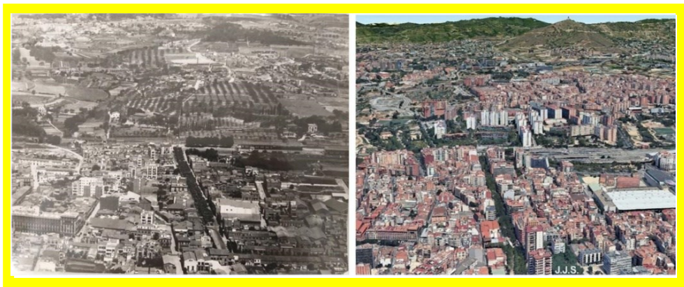
Imatges comparatives: L'Hospitalet anys 70 i als anys 2000.